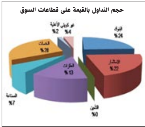
حجم التداول بالقيمة على قطاعات السوق

وتوقع دشتي أن تحقق الشركة ما نسبته 15% على رأس المال بالنسبة لحجم العقود التي تتطلع الشركة إلى إنجازها هذا العام، كما توقع أن يتم الكشف عن مشروع وصفه بالضخم في الأردن يبلغ حجمه نحو 150 مليون دينار أردني عن طريق صفقة كبيرة. وأشار دشتي إلى توقيع