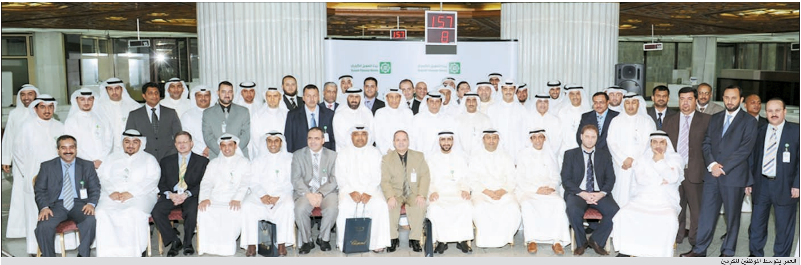
العمر يتوسط الموظفين المحرمين

أكد خلال تكريم الموظفين المتميزين أن البنك يعول كثيراً عليهم خلال المرحلة المقبلة