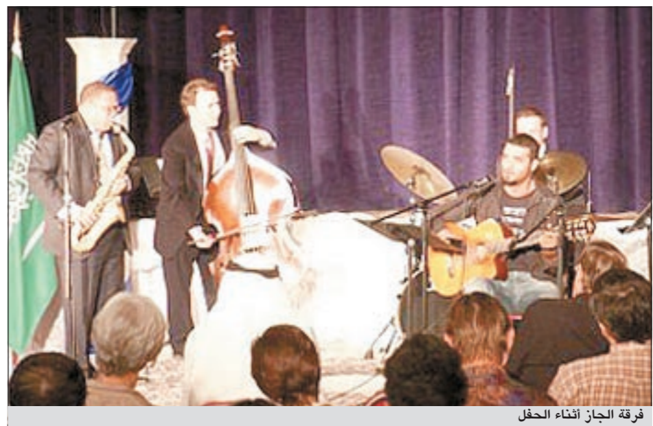
فرقة الجاز أثناء الحفل

عربي، وسادس «موسيقار» عالمي يحصل على الجائزة. واستمرت الفرقة الأميركية بعد أن أحييت تراث العميد السعودي في مغازلة الجمهور العربي، حيث عزّفت بفخامة «الساكسفون»