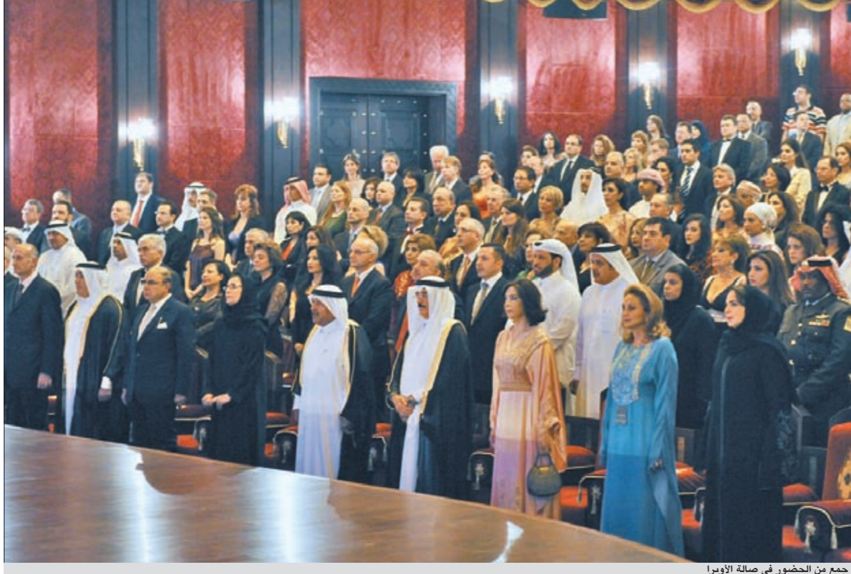
جمع من الحضور في صالة الأوبرا