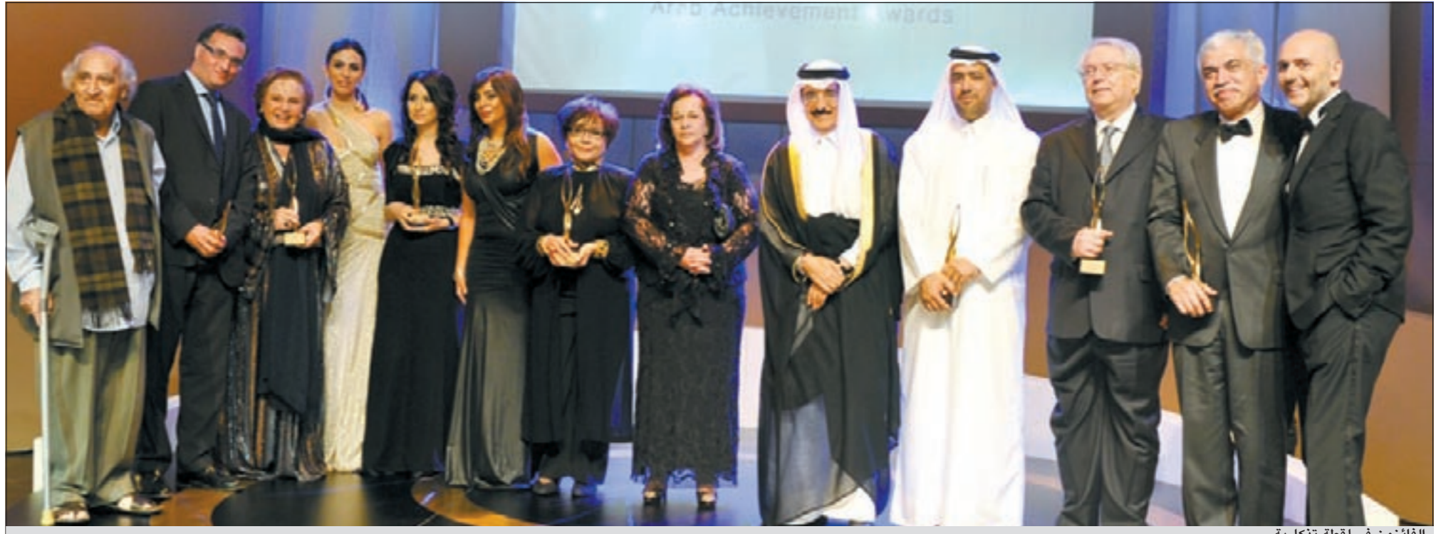
الفائزون في لحظة تذكارية