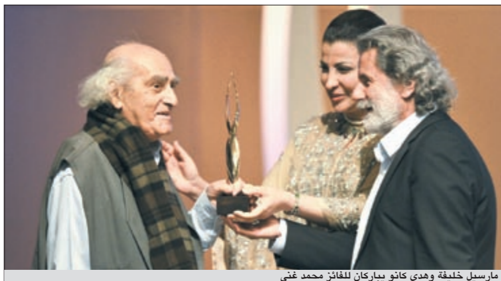
مارسيل خليفة وهدي كانو يباركان للفائز محمد غني

تحت رعاية صاحب السمو أمير دولة قطر، الشيخ حمد بن خليفة آل ثاني، وبالتعاون مع وزارة الثقافة والفنون والتراث، جرى تكريم نخبة من أبرز المبدعين تقديراً لإنجازاتهم الاستثنائية، خلال حفل مميز أقيم في «الحي الثقافي-كتارا»، الدوحة - قطر، يوم 30 أبريل الماضي. وقدمت نجمة قناة الجزيرة ليلى الشخيلي هذه الإسمية الفريدة التي تميزت بحضور أكثر من 500 شخصية عربية وعالمية مرموقة.