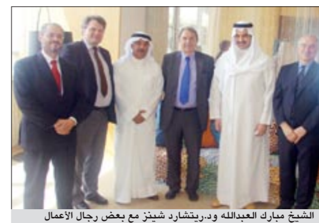
الشيخ مبارك العبدالله ودرينشارد شينز مع بعض رجال الأعمال

الاجنبي وشركة الأوفست القادمة من النمسا إلى الكويت كما انه دعما الجانب الكويتي لزيارة النمسا.