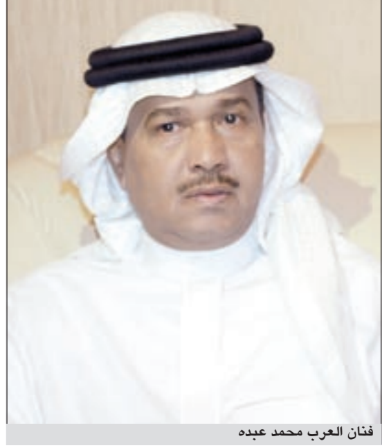
فنان العرب محمد عده