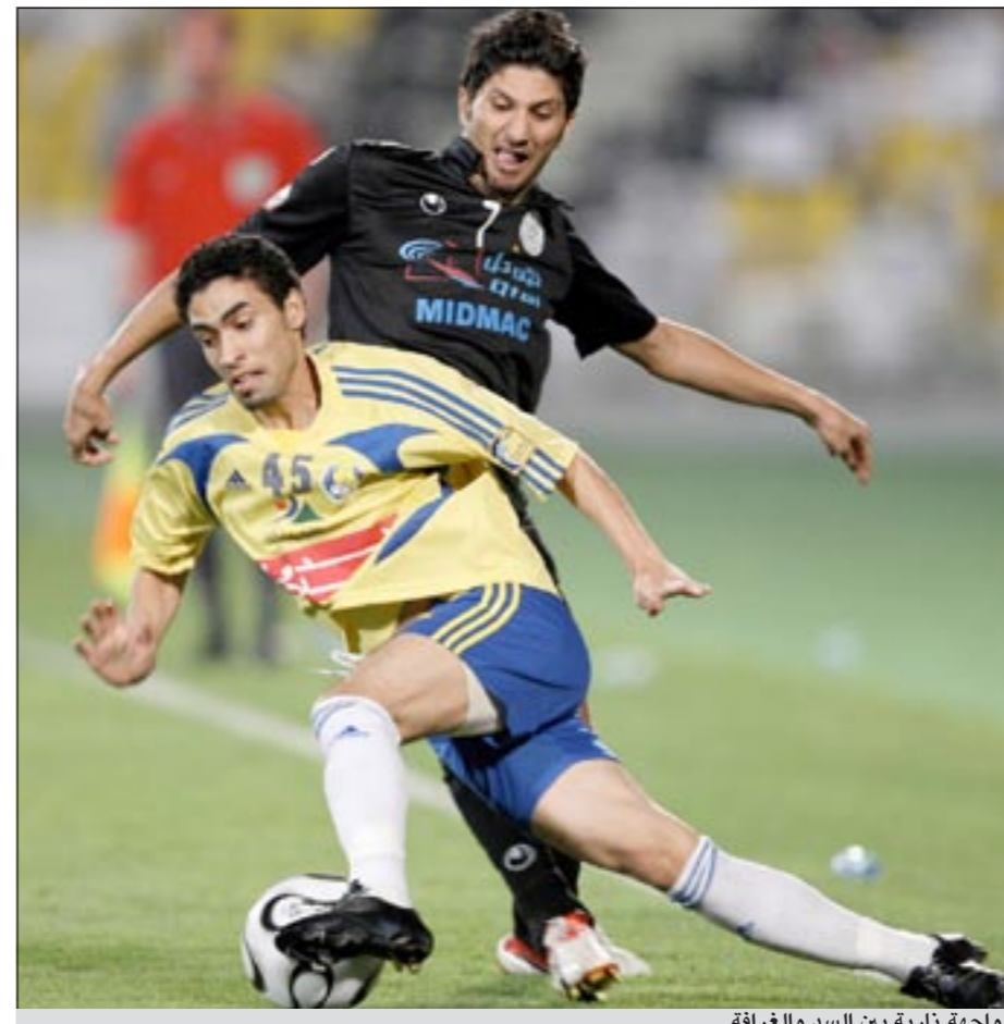
مواجهة نارية بين السد والغرافة

أعلنت لجنة المنتخب الوطني بالاتحاد القطري لكرة القدم برنامج استعداد المنتخب الأول للمرحلة الثانية من تصفيات كأس العالم 2014، حيث تقرر أن يخوض اللاعبون المختارون للقاءات التدريبات عقب انتهاء مباريات أنديةهم في كأس الأمير وحتى 20 الجاري.