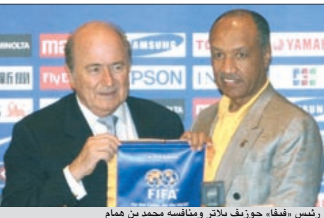
رئيس «فيفا»، جوزيف بلاتر ومنافسوه محمد بن همام

الأولى على مستوى العالم بعد أكثر من قرن من الزمن على تولي الرئيس الأول الفرنسي روبير جورين 1904 - 1906م. ومنذ عام 1998 يرأس السويسري بلاتر «75 عاماً» الـ «فيفا»، وهو من ضمن سبعة أوروبيين وصلوا كرسي الرئاسة فيعهد الرئيس الفرنسي جورين جاء الإنجليزي ولوفول والفرنسي ريميه والبلجيكي سيلدريز والإنجليزي دروري والإنجليزي روس ولم يحتل هذا المنصب من غير القارة العجوز الا البرازيلي جواو هافيلانج.