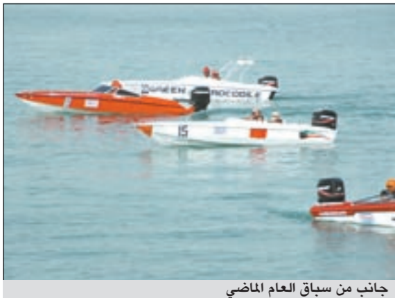
جانب من سباق العام الماضي

تقيم اللجنة البحرية في النادي البحري في الثالثة عصر اليوم سباق الكويت الثاني لقوارب «النزهة» في المنطقة البحرية المقابلة لمطعم فرايديز بمسافة من 36 إلى 40 كم وبمشاركة 10 فرق محلية. وذلك في إطار احتفالات النادي البحري باليوبيل الذهبي بمرور 50 عاماً على الاستقلال و20 عاماً على التحرير و5 أعوام على تولي صاحب السمو الأمير مقابله الحكم.