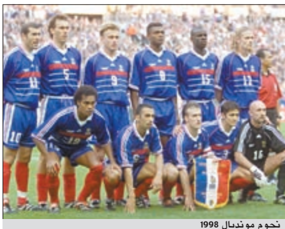
نجوم مونديال 1998

تسبب الحديث الذي نشر مؤخراً لمدرّب منتخب فرنسا لوران بلان وهو يقول فيه انه مع «تحديد عدد اللاعبين مزدوجي الجنسية» في مراكز تدريب الناشئين، بانقسام عرقي بين لاعبي تشكيلة 1998 التي قادت «الديوك» الى لقبه المونديالي الأول والأخير، اذ انتقده لاعبون مثل باتريك فييرا وليليان تورام ودافع عنه آخرون مثل كريستوف دوغاري وبيكسنتي ليترازازو. وكان موقع «ميديا بار» كرسفا عن وجود قرارات داخل اللجنة الوطنية للعبة في فرنسا عملت للحد من نسبة اللاعبين من أصول أفريقية وعربية بما لا يتجاوز نسبة 30٪، تم كشف عن رسوم بيانية وضعتها المدير الفني الوطني المسؤول عن تحديد سياسة تدريب الناشئين، فرانسوا بلاكار الذي اوقف على خلفية هذه القضية، يظهر فيه نسبة اللاعبين السود ومن اصل عربي في منتخبات الناشئين والتي تتراوح بين 40 و50٪ والهدف منها إقناع الاتحاد الفرنسي بحجم «المشكلة». وبحسب تقرير «ميديا بار» الذي تناقلته معظم الصحف الفرنسية نهاية الأسبوع الماضي وخصوصاً «ليكيب» الواسعة الانتشار تحت عنوان «بالنسبة إلى المسؤولين الفرنسيين عن الكرة، ثمة عديد من الأفرقة والعرب في الفريق الوطني الفرنسي، وليس هناك عدد كاف من أصحاب البشرة البيضاء».