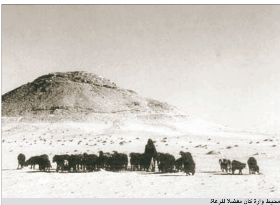
محيط وارة كان مفضلا للرعاة

العصيان على ملك الحيرة «عمرو بن هند» وأخذت تغير على قطعان إبله وتنهت لطائمه «قوافله التجارية» المتجهة إلى الحجاز والبحرين واليمن، فسير عليهم حملة عسكرية كبيرة يقودها بنفسه، ودارت على أرض وارة معركة شديدة انكسرت فيها قبيلة بني تميم، واسر الملك «عمرو بن هند» منهم أسرى كثيرين، فأمر بهم فحرقوا وذبحوا على جبل أواره، وبعد هذه المعركة أعلنت قبيلة بني تميم الطاعة للملك «عمرو بن هند».