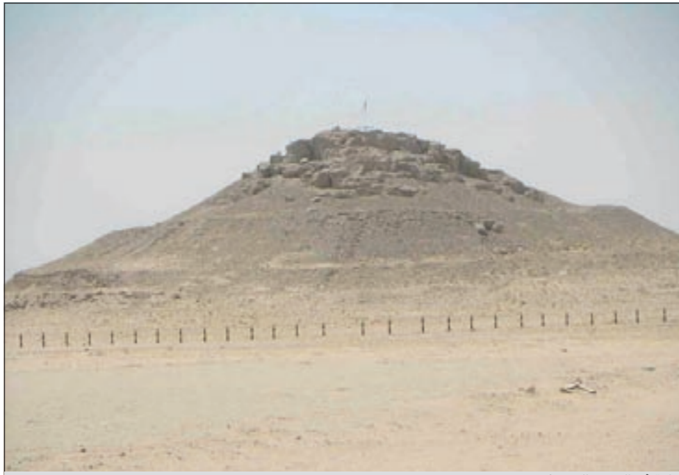
وارة في العصر الحديث

● بقلم: أحمد بن محارب الظفيري باحث في التاريخ والتراث aalhdhafi@yahoo.com