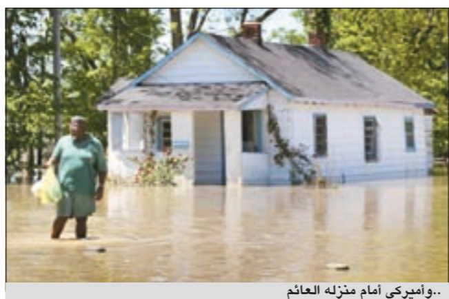
فيضان في منزل العائم

للاطمار والعواصف المروعة هذا العام عبر مناطق الغرب الأوسط والجنوب بحدوث فيضانات قياسية جديدة من الفيضانات خلال الأسابيع المقبلة قد تقارن في قوتها بالفيضانات التاريخية عام 1937.