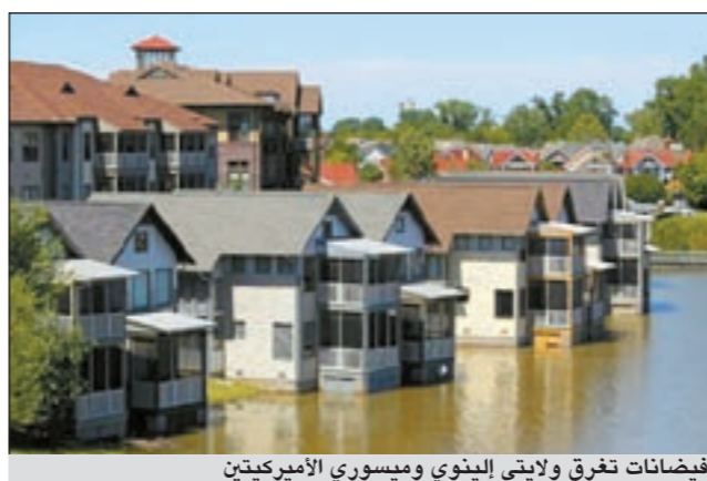
فيضانات تغرق ولايتي إلينوي وميسوري الأميركيين

ولميسوري الأميركيين. وتحدث الفيضانات بشكل سنوي تقريبا مع ذوبان الجليد وامتلاء هذا المجرى المائي الأطول في شمال أميركا بمياه أمطار الربيع. وينذر الهطول القياسي وادي النهر في ولايتي إلينوي