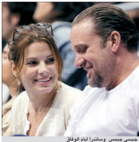
جيسي جيمس وساندرنا بولوك

نيويورك - د.ب.أ: أكد جيسي جيمس، طليق الممثلة الأميركية الشهيرة ساندرنا بولوك، أنه لم يعد يفكر فيها الآن. وقال جيمس في مقابلة مع محطة «إيه.بي.سي» الأميركية «لا يمكنني أن أشعر بالقلق عليها (بولوك) بعد الآن، لقد قضيت الأعمار الخمسة أو الستة الماضية وأنا أفكر فيها، وما تفكر هي فيه، وبما ينبغي أن أفعله وبالسيطرة على كل تحركاتي». وأضاف جيمس «أعتقد أنه حان الوقت لأهتم بجيسي وأتأكد من أن جيسي سعيد». من ناحية أخرى، ذكر جيمس أنه لم تنتج له الفرصة للتعرف على ابن بولوك بالتبني لويس، موضحاً أنه كان يرغب في تبني الطفل مع بولوك، إلا أن طلاقهما حال دون ذلك. يذكر أن بولوك انفصلت عن جيمس رسمياً في يونيو عام 2010 بعد اكتشافها خيانتها لها مع أخريات خلال فترة زواجهما.