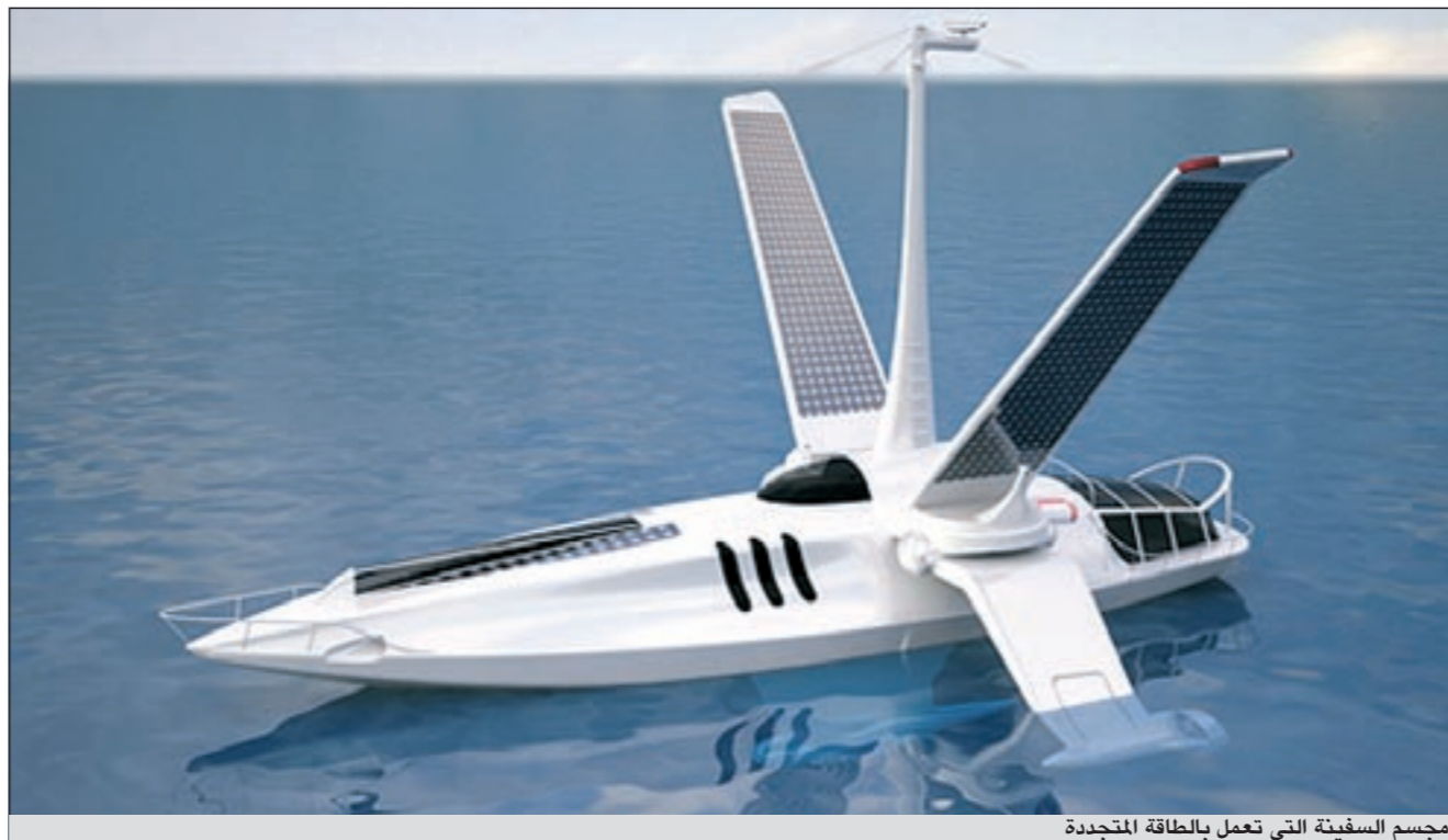
مجموع السفينة التي تعمل بالطاقة المتجددة

جاسم سيد علي إبراهيم الرفاعي - 41 عاماً - عبدالله المبارك - ق 6 - ش 605 - م 42 - ت: 65150550 - 66844339. منيرة مشاري راشد الأرملي، زوجة جاسم محمد راشد الأرملي - 57 عاماً - الشامية - ق 4 - ش 41 - م 8 - ديوان الأرملي - مقابل مبنى التعويضات - ت: 99616229. زهرة مبرز باقر السليمي، زوجة حسن عبدالله الموسى - 76 عاماً - الرجال: الحسينية الجعفرية - خلف مجمع الصوابر - ت: 66777801 - 66000558 - النساء: المنصورية - ق 1 - ش 10 - م 15 - ت: 66606685 - 66007066. رائد خالد راشد بورسلي - 68 عاماً - الرجال: ديوان بورسلي - الشامية - ق 4 - ش 4 - م 15 - ت: 24843510 - النساء: الروضة - ق 3 - ش 32 - م 2 - ت: 22532443. منسي محارب خلف العنزي - 85 عاماً - العارضية - ق 10 - ش 5 - م 2 - م 16 - ت: 99516688. عزيز ذغيب نائل العنبي - 70 عاماً - الفردوس - ق 4 - ش 1 - م 11 - م 31 - ت: 99835623 - 60444317. سلمان العجران الخالدي - 61 عاماً - الرجال: الاحمدى - ق 10 الاوسط - طريق 3 الأعلى - م 15 - ت: 60308890 - النساء: الاحمدى - ق 10 الاوسط - طريق 3 الأعلى - م 13 - ت: 66977977. فجر فايز ميثب العنبي - 67 عاماً - اشبيلية - ق 1 - ش 110 - م 20 - ت: 99099030 - 66455775 - الدفن التاسعة صياحبا. فالح سالم محمد عوض العازمي - 80 عاماً - الصباحية - ق 4 - ش 16 - م 863 - ت: 97261061 - 23611221. صالح فراج صالح فراج - 55 عاماً - الرجال: الروضة - صالة دسمان - ت: 97605055 - 66503087 - النساء: الرقة - ق 7 - ش 4 - م 262 - ت: 99410009 - 23969264.