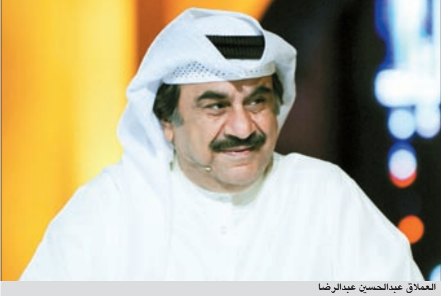
العلاق عبدالحسين عبدالرضا

قائد يسوي في حلقة؟ يشوي بيض في حلقة؟» ثم قال القذافي: «دقت ساعة العمل.. دقت ساعة الزحف.. دقت ساعة الانتصار.. لا رجوع.. إلى الأمام.. إلى الأمام.. إلى الأمام»، فتنقل الصورة إلى لحظة صفاق فيها عبدالرضا للنجم القدير داود حسين الذي كان يتراقص في المشهد، ومن بعده حياة الفهد عندما هتفت «يعيش اللي حاميانا» الجدير بالذكر أن برنامج «الفن وأهله» يقدم مجموعة من الفقرات الفنية والغنائية المبتكرة من أنجح البرامج التي قدمت، مثل «جلسات وناسة» بمواسمه المختلفة، و«الليلة مغني»، و«أبشر»، و«نجوم الخراب»، كما يضم أيضا مجموعة من المواقف المسلية، والوقفات الكوميدية من مختلف المسرحيات والأفلام العربية.