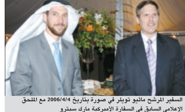
المرشح المرحوم ماثيو تويلر في صورة بتاريخ 2006/4/14 مع الملحق الإقليمي السابق في السفارة الأميركية مارك ستيترو

واشنطن - كونا: أعلن البيت الأبيض الليلة قبل الماضية أن الرئيس باراك أوباما قام وترشح ماثيو تويلر سفيراً أميركياً جديدا لدى الكويت. ويعمل تويلر في السلك الدبلوماسي الأميركي منذ عام 1985 ويشغل حاليا منصب نائب رئيس بعثة السفارة الأميركية في القاهرة وعمل سابقا في السفارة الأميركية في بغداد ونائبا لرئيس البعثة في سفارة الكويت.