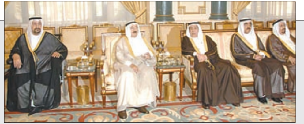
أمير وولي العهد وأسرة آل الصباح تلقوا التعازي في وفاة الشيخ خالد الأحمد

الخرافي وجه الدعوة لعقد جلسة الثلاثاء المقبل.. والساير باق.. و«الكهرباء» حسمت للأذينة والعفاسي سيتولى «العدل» و«الشؤون» والنومس «الأوقاف»