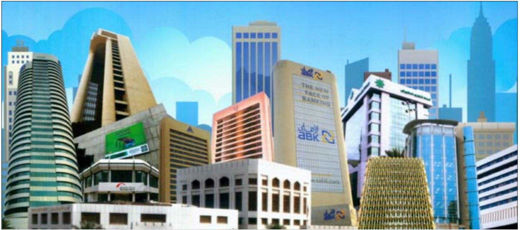
نمو الائتمان المحلي مرهون بتنفيذ مشاريع التنمية

القاهرة - كونا: قال مندوبنا الدائم لدى الجامعة العربية السفير جمال الغنيم إن اجتماع المجلس الاقتصادي والاجتماعي على مستوى كبار المسؤولين الذي عقد أمس تركّز على تفعيل المشروعات الاقتصادية العملاقة التي أقرتها القمة العربية الاقتصادية خاصة مبادرة صاحب السمو الأمير الشيخ صباح الأحمد لإنشاء صندوق لدعم المشروعات الصغيرة والمتوسطة.