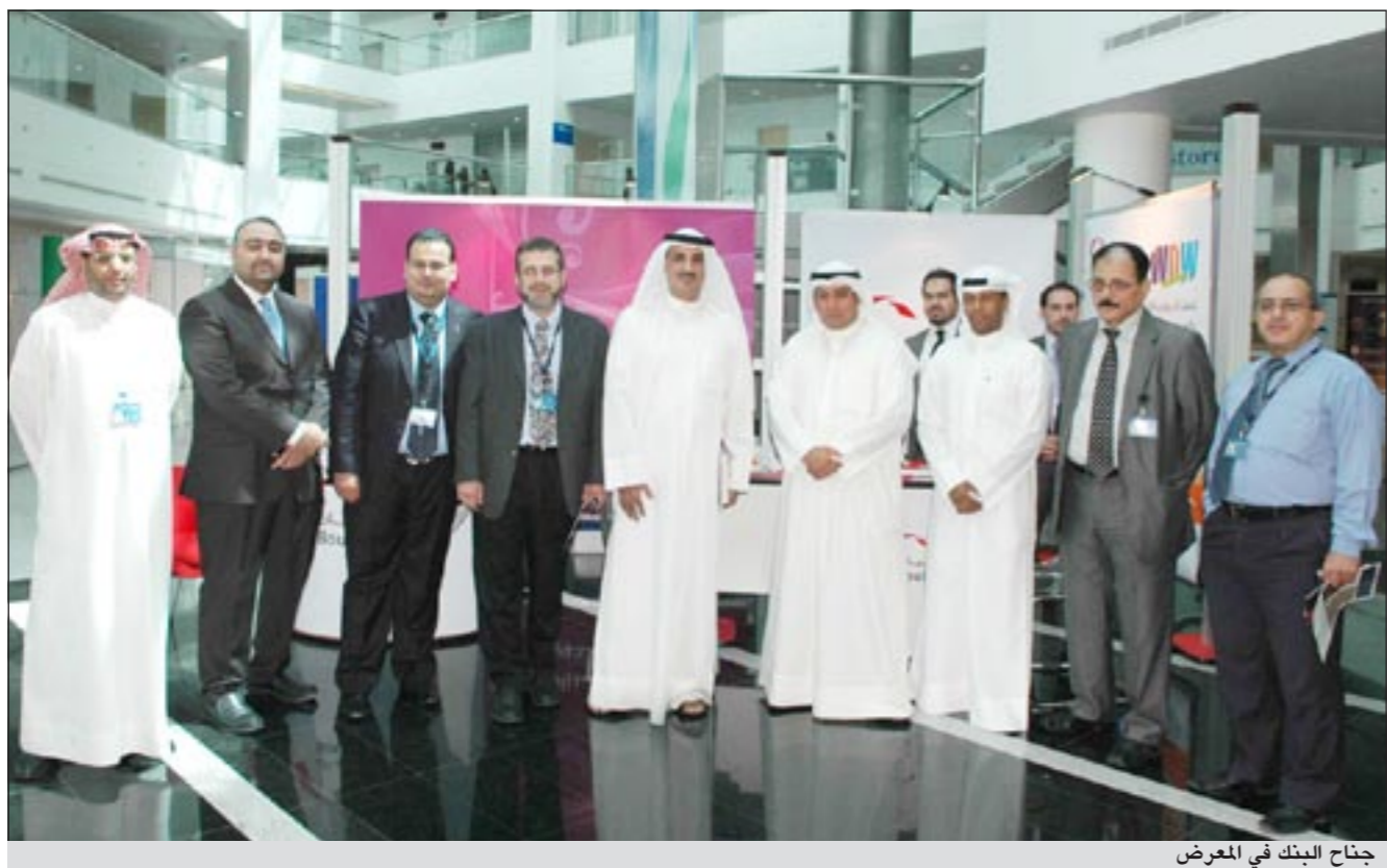
جناح البنك في المعرض

تدريبية بمكافأة في فترة الصيف كما يقدم أيضاً خصماً يصل إلى 50٪ على التأمين الشامل على السيارات وتأمين السفر. ويقدم حساب «WOW» مجموعة من الخدمات والمنتجات المجانية لعملائه من جمهور الطلبة والطالبات في الجامعات والكليات والمعاهد الحكومية