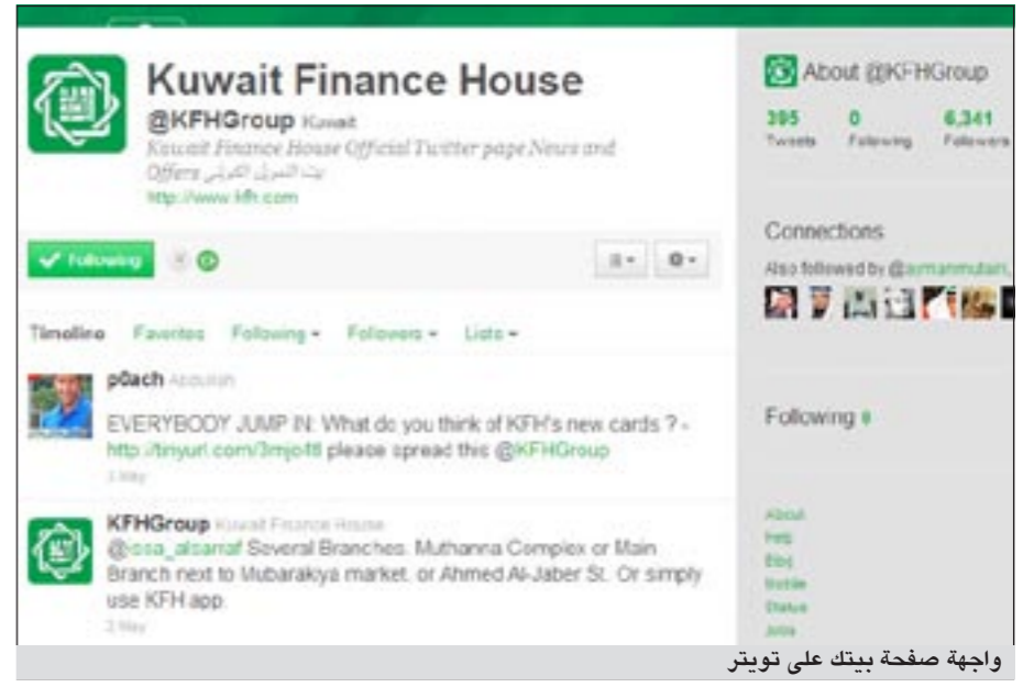
واجهة صفحة بيتك على تويتر

سياسية التواصل الهادفة إلى تحقيق المنفعة العامة للمجتمع، بالإضافة إلى الرسالة الرئيسية التي يتوخى «بيتك» تأكيدها لعملائه أنه معهم دائماً، كما يشاركهم تطوراتهم واهتماماتهم، خاصة أن مجال التقنية ووسائلها الحديثة أصبحت مؤثرة وتحظى بمتابعة واهتمام الملايين، كما أنها أيضاً من خلال الاهتمام وتفعيل التواجد عبرها تعمق الصورة الإيجابية عن «بيتك». وتوجه توفيقي بالشكر لمتابعي صفحة بيتك على موقعي التواصل الاجتماعي فيس بوك وتويتر على حرصهم الدائم على التفاعل الإيجابي مع رسائل بيتك، بل وقيامهم بمبادرة نشر هذه الرسائل، خاصة تلك التي تتضمن أخباراً وعروضاً ومساهمات يجودون بها من الأفضل أن يتم تعميمها وإيصالها إلى أكبر قدر من المستخدمين، وهكذا فإنهم يساهمون في استقطاب زوار جدد في الغالب يتحول أكثرهم فيما بعد إلى عملاء لـ «بيتك» في تأكيد فاعلية هذه الوسائل في تحقيق تواجد ملموس بين قطاعات بعينها وأهمها الشباب.