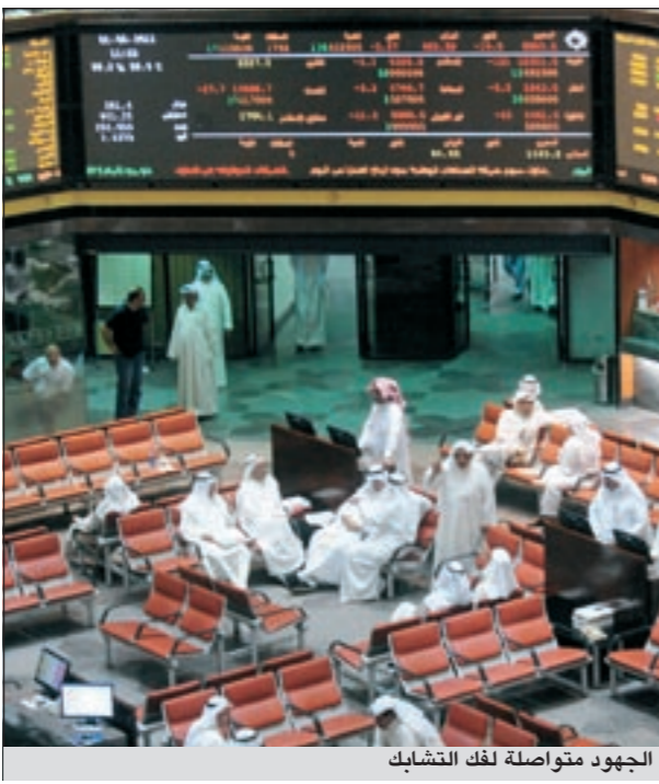
الجهود متواصلة لفك التشابك

علمت «الانباء» من مصادر مطلعة أن إدارة سوق الكويت للأوراق المالية قد شكلت لجنة تضم قانونيين وفنيين للالتقاء من عمليات فك التشابك مع هيئة أسواق المال، لافتة إلى أن هناك أموراً يومية مازالت غير واضحة للجانبين أبرزها عمليات نقل الملكيات بين المحافظ والتعليمات الخاصة بزيادة رؤوس الأموال.