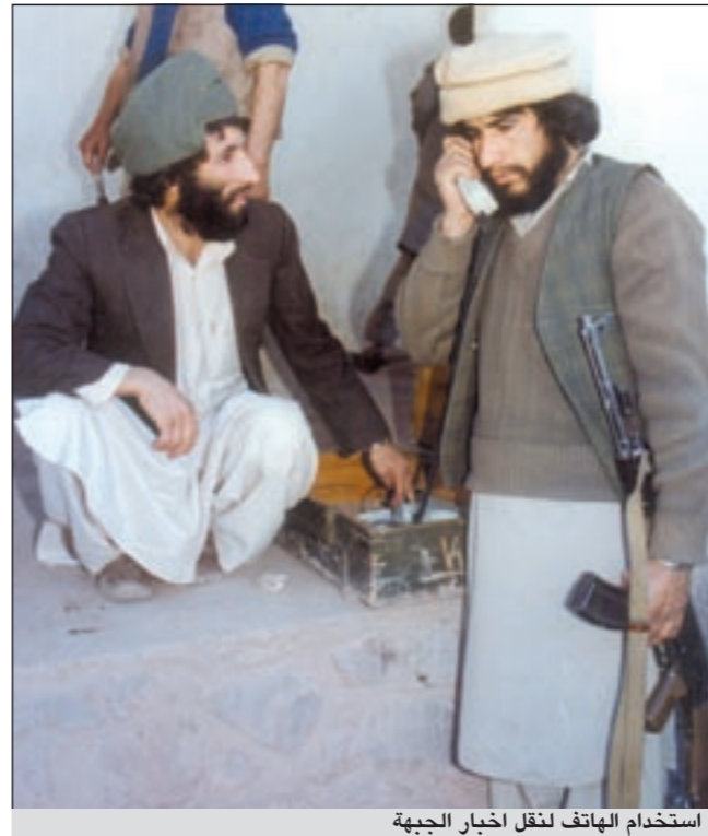
استخدام الهاتف لنقل اخبار الجبهة

قال في صراحة متناهية: انا خريج جامعة واشنطن، قمت بتغطية معارك «واي البنشر» وحصلت على 50 ألف دولار مع القضية أيضاً من منطلق عقائدي فأنا فقيدت اخي في فيتنام وقد هيا الله لي هذه الفرصة كي اشرع في «الروس» في الوجل الأفغاني، قلت وانا اقصد ان اتمنى في الحوار معه: بودي ان اناقش معك ما قرأته من ان هناك اتفاقاً سرياً ما بين الغرب والسوفييت يتضمن منع قيام دولة اسلامية في أفغانستان؟ قال: اعتقد انه ليس من المصلحة ان تقوم دولة للجهاد في أفغانستان (اسلامية) لان هذا خطر كبير على دول مجاورة لافغانستان مثل باكستان وايران والهند ودول آسيا الوسطى المتحالفة ضمن الاتحاد السوفيتي ونفضل نحن كغرب ان تكون دولة ديموقراطية ليبرالية وهذا يبدو مقبولاً لان الانظمة في العالم تخاف الدولة الإسلامية المم بروستانتيا.