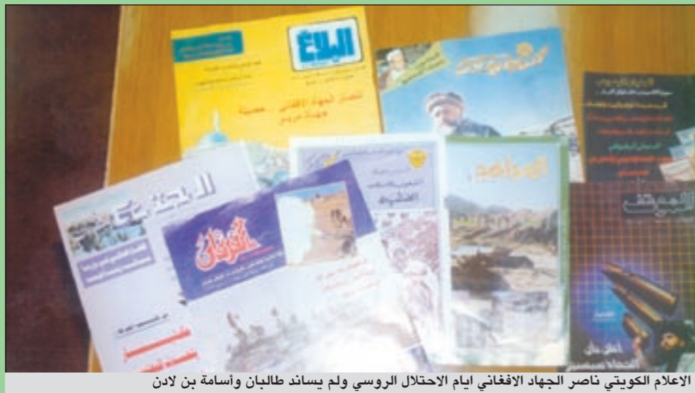
الإعلام الكويتي ناصر الجهاد الأفغاني أيام الاحتلال الروسي ولم يساند طالبان وأسامة بن لادن