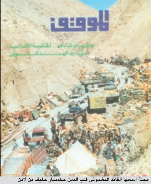
مجلة اسسها القائد البشتوني قلب الدين حكمتيار حليف بن لادن