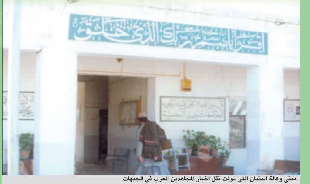
مبنى وكالة البنيان التي تولت نقل اخبار المجاهدين العرب في الجبهات

كوادر بشرية إعلامية متخصصة في التطرف الأصولي اما المعتدلون فقد تسربوا هنا وهناك لمارسوا أدوارهم الإعلامية بهمة ونشاط