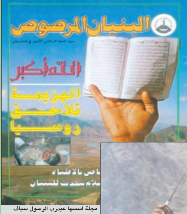
مجلة اسسها عبدرب الرسول سياف