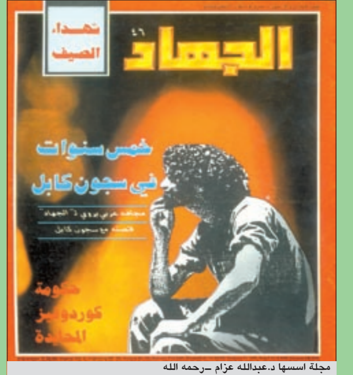
مجلة اسسها د.عبدالله عزام -رحمه الله