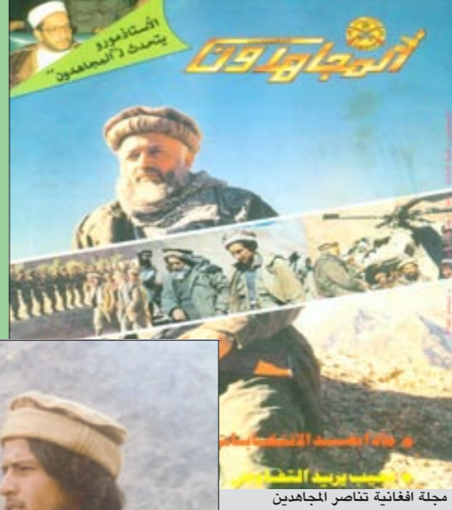
مجلة افغانية تناصر المجاهدين