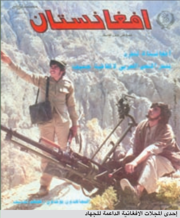
إحدى المجلات الافغانية الداعمة للجهاد