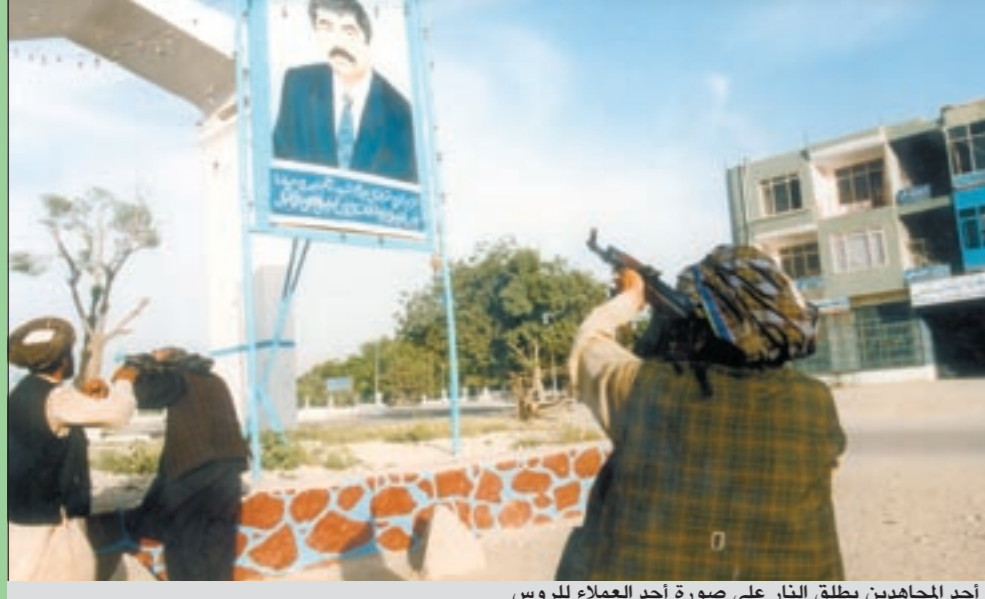
أحد المجهدين يطلق النار على صورة أحد العملاء للروس