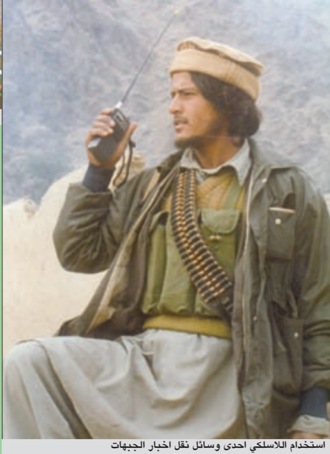
استخدام الاسلحة احدى وسائل نقل اخبار الجبهات