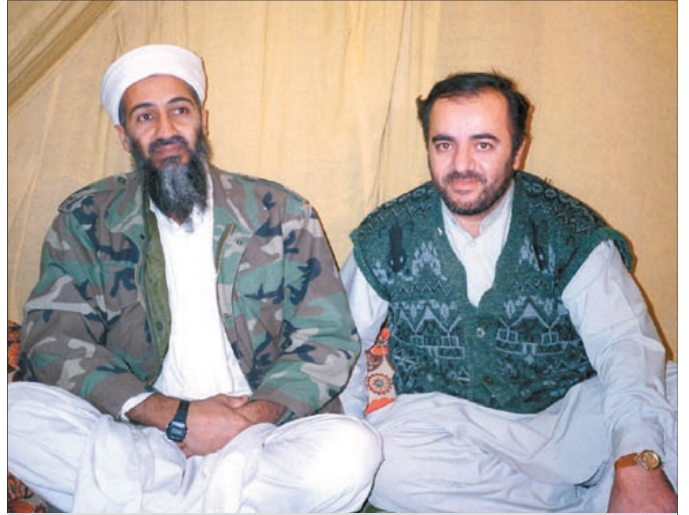
الصحافي والإعلامي جمال إسماعيل مع أسامة بن لادن خلال اللقاء الشهير الذي أجراه معه عام 1998

من زعيم التنظيم بالقاعدة بـ «الوكالة». د.أيمن الظواهري، وحتى تكون في الصورة فعدد المقاتلين العرب سواء المنتمون للقاعدة أو غير المنتمين لها أو المتواجدين في منطقة القبائل بين أفغانستان وباكستان لا يتجاوز الـ 150 مقاتلا.