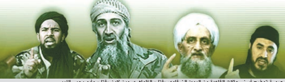
صورة توضح أبرز رجالات القاعدة من اليمين الزرقاوي «قتل» الظواهري وبن لادن «قتل» وأبو يحيى اللبيبي