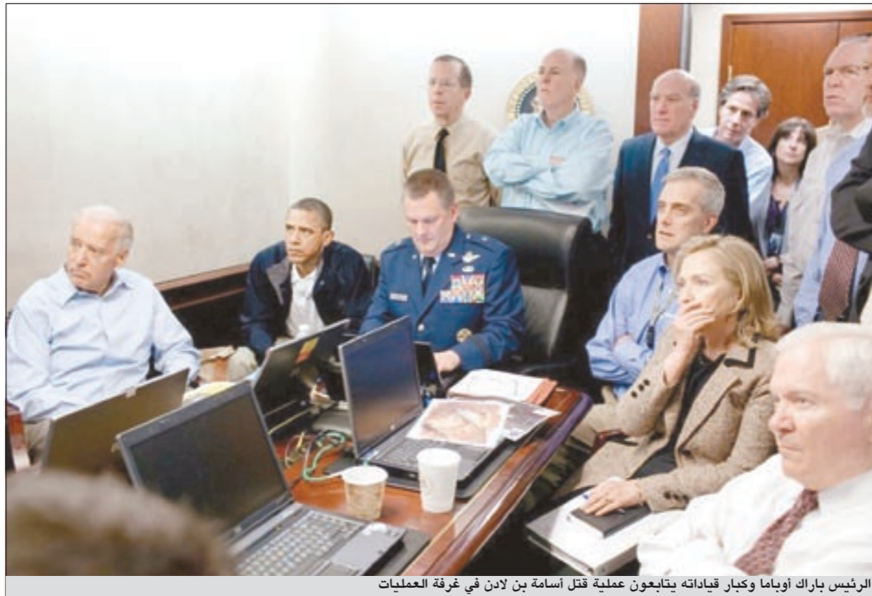
الرئيس باراك أوباما وكبار قياداته يتابعون عملية قتل أسامة بن لادن في غرفة العمليات

كشف البيت الأبيض عن أن الرئيس باراك أوباما ونائبه ووزير الخارجية هيلاري كلينتون ووزير الدفاع روبرت غينس ورئيس الإركان مايك مولن كانوا جميعاً يتابعون عملية الهجوم على مبنى أسامة بن لادن بصورة حية خلال حدودها وذلك في غرفة العمليات بالبيت الأبيض. وقال مصدر مقرب من فريق الأمن القومي الذي احاط بأوباما خلال متابعة الهجوم دقيقة بدقيقة أن جوا المحصنة والمزودة بأحدث أجهزة الاتصال في العالم وان الصمت لم يكن يقطع الا بصوت طلقات الرصاص المتواصلة التي تبادلها بعض الموجودين بالقبلا التي أختبا فيها بن لادن، ومهاجموه من قوات «سيل» التابعة للبحرية الأميركية.