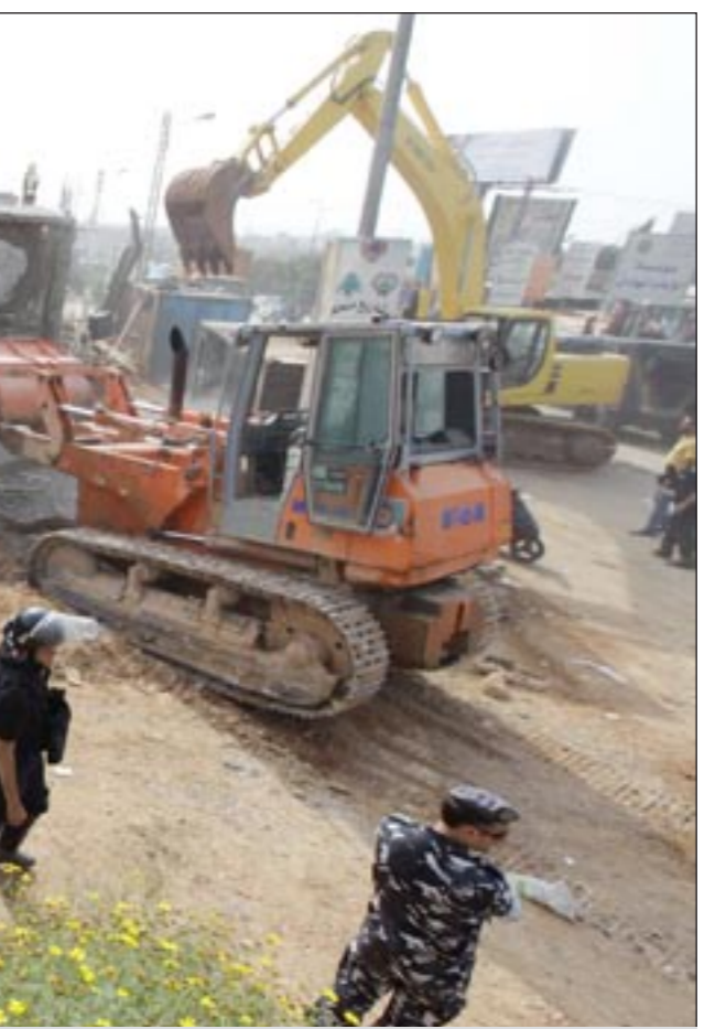
قوى الأمن تحرس إحدى الجرافات التي تزيل المخالفات جنوب بيروت أمس

وفي هذه الأثناء قال رئيس مجلس النواب نبيه بري أنه مستاء كثيراً من الوضع الذي آلت إليه عملية تاليف الحكومة