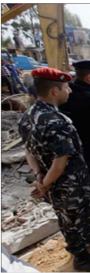
قوى الأمن تحرس إحدى الجرافات التي تزيل المخالفات جنوب بيروت أمس

بعد الحملة الجديدة التي شنها العماد عون وكتلته على الرئيس سليمان وعلى رئيس الحكومة المكلف محملاً إياهما مسؤولية عدم تاليف الحكومة، بسبب امتناعهما عن توزيع الحقائق الوزارية على الكتل النيابية. وردا على الإيحاء بأن مطالب الكتل النيابية تعطل تاليف الحكومة قال لقناة المنار: يجب تحديد الكتل، وليس الاكتفاء بالتمهيم. وحفل عون الرئيس ميشال سليمان والرئيس المكلف ميفاتي ومسؤولية عدم تاليف الحكومة «لأنهما يمتنعان حتى اللحظة عن توزيع الحقائق الوزارية عن الكتل». ورأى عون في حديث لقناة المنار الناطقة بلسان حزب الله ان