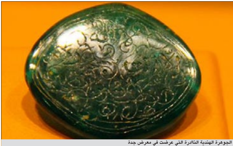
الجوهرة الهندية النادرة التي عرضت في معرض جدة