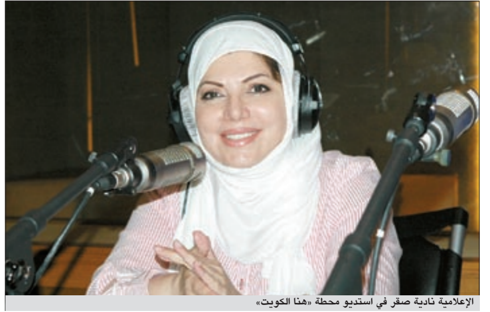
الإعلامية نادية صقر في استديو محطة «هنا الكويت»