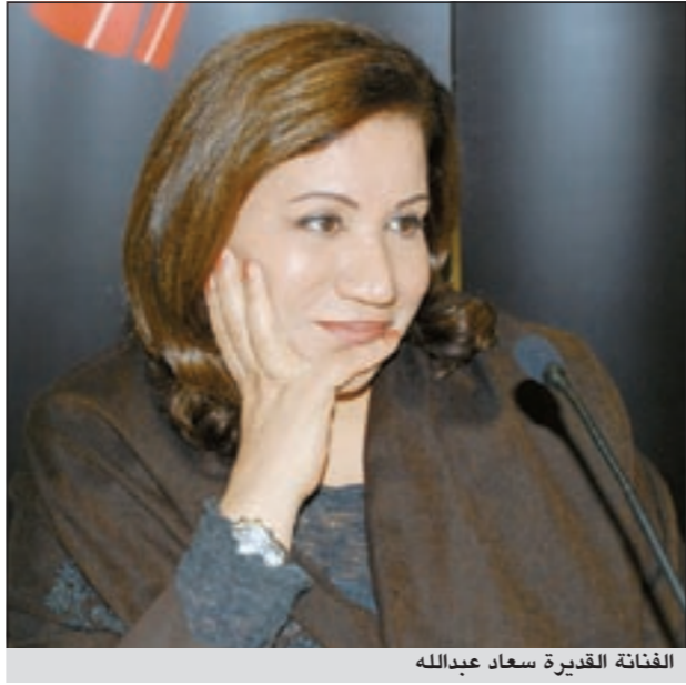
الفنانة القديرة سعاد عبدالله