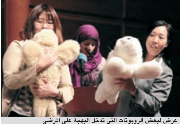
عرض لبعض الروبوتات التي تدخل البهجة على المرضى