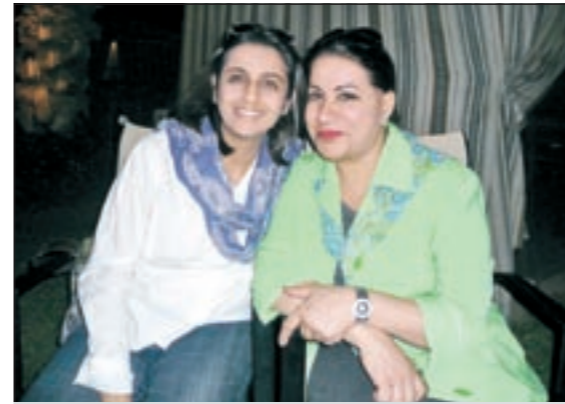
الفنانة القديرة سعاد عبدالله مع هبة حمادة

ناخذ فترة راحة، لا أكثر ولا أقل. اما عن علاقتنا مع بعضنا فهي «سمن على عسل».