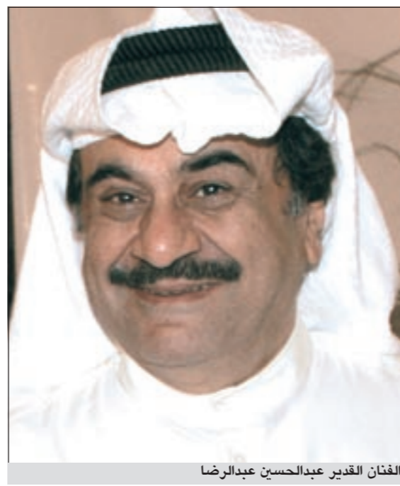
الفنان القدير عبدالحسين عبدالرضا

خصوصاً بعد النجاحات السابقة وأخرها «زوار الخيمس»، وذلك لكي نخرج بأفكار جديدة مبتكرة ولا نقع في التكرار، فقررنا أن