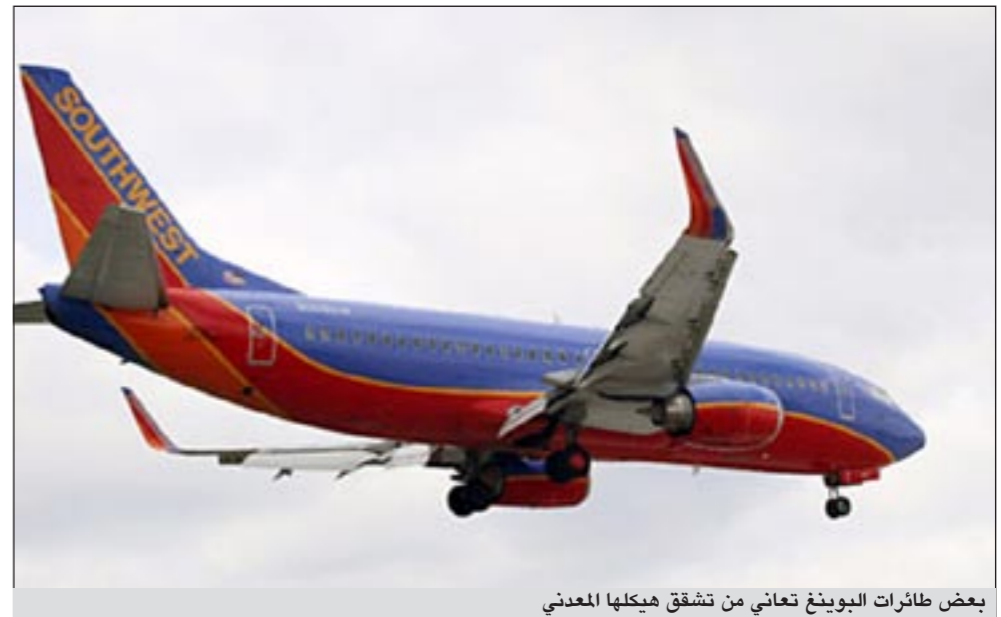
بعض طائرات البوينغ تعاني من تشقق هيكلها المعدني

وكالات: في عام 1988 انفصل سقف طائرة بوينغ 737 تابعة لشركة ألوا إيرلاينز الأمريكية عندما كانت تحلق في الجو، وندفت إحدى المضيفات بفعل دفع الهواء الجبار إلى خارج الطائرة لتلقي مصرعها في الأعلى. الحادثة دقت ناقوس الخطر في صناعة الطيران بشكل عام من احتمال ترقق واهتراء مناطق معينة في أجسام الطائرات القديمة. وقامت شركات الطيران وقتها بحملة مكثفة لتفحص أجسام طائراتها القديمة، بينما قام مسؤولو سلامة الطيران الفيدراليون الأمريكيون بقطع وتفحص الأجزاء الأكثر تعرضاً للضغط في أجسام الطائرات للبحث عن أي مواطن ضعف. أما شركة بوينغ المصنعة لطائرة ألوا إيرلاينز المكتوبة فقد هرعت لإعادة تصميم مفاصل الطائرة، واعتقد الجميع أن المشكلة قد حلت. غير أن اكتشاف فتحة بمساحة خمسة أقدام في سقف طائرة بوينغ 737 تابعة لشركة ساوث ويست إيرلاينز هذا الشهر بالإضافة إلى حوادث أخرى