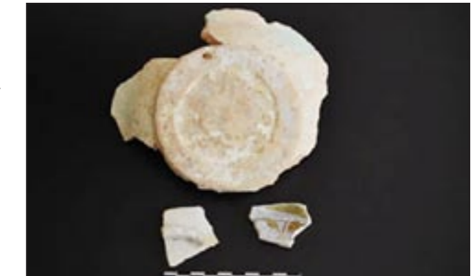
أحد الآثار التي تم اكتشافها