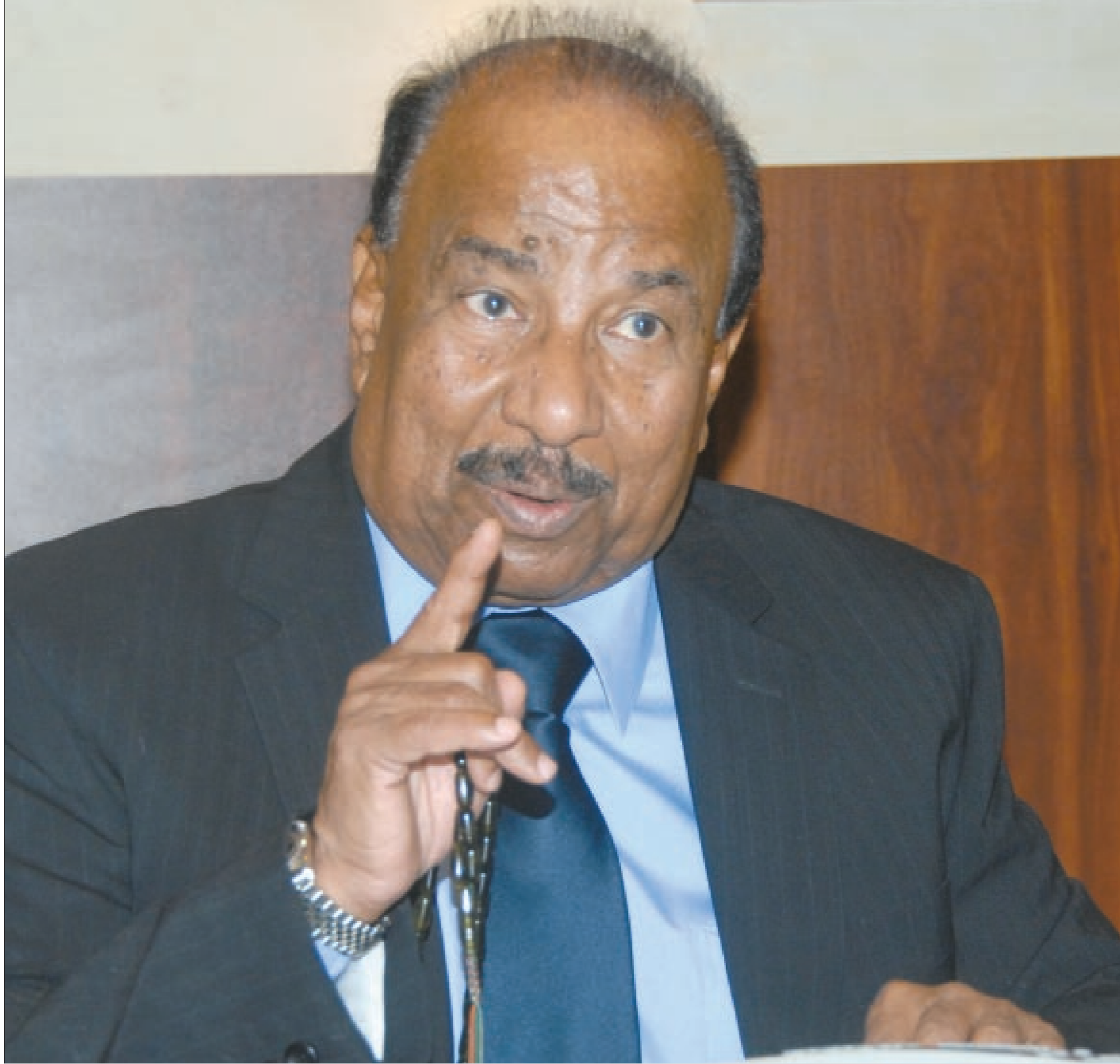
شيخ المعلقين خالد الحربان خلال تواجده في ديوانية «الأنباء»