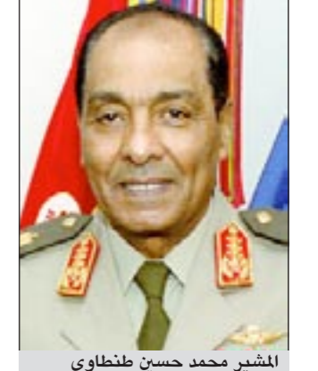
المشير محمد حسين طنطاوي