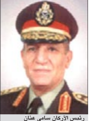
رئيس الأركان سامي عتار