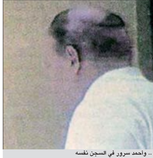
.. وأحمد سرور في السجن نفسه