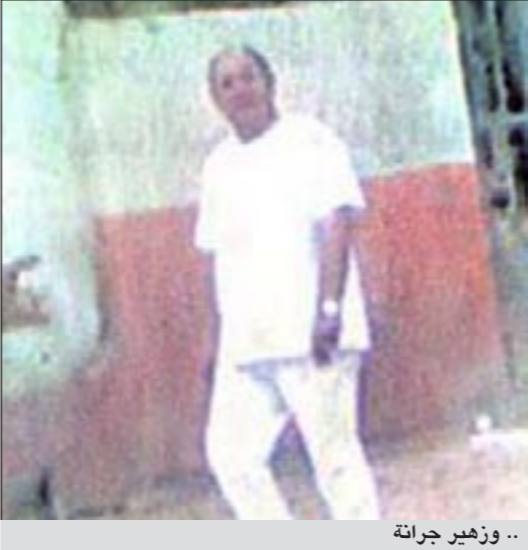
.. وزهير جرانة

القاهرة - إم بي سي نت: ألفت مجلة مصرية الضوء على ذكرى ميلاد الرئيس المصري السابق حسني مبارك، التي توافق 4 مايو 1928، حيث يدخل بعد أيام قليلة عامه الـ 84 بلا احتفالات شعبية وإعلامية كما جرت العادة كل عام. ووضعت مجلة «روز اليوسف» في عددها الصادر السبت 30 أبريل صورة «كاريكاتورية» على صدر غلافها، وقالت: «انه في الرابع من مايو كل عام كان يحتفل مبارك بعيد ميلاده بين قصور القاهرة وشواطئ شرم الشيخ، لكن عيد ميلاده هذا العام صافد أن يكون محبوسا على نمة التحقيقات في مستشفى شرم الشيخ. وجاء في المجلة تحت عنوان «عقبالك يوم ميلادك لما تقول وتريح بالك، هدية مقبولة يا ريس»: عيد ميلاده الـ 84 يمكن لمبارك أن يرسم نهاية تخفف مهانة السقوط، فقط أن يلتمز بالعهد الذي قطعه على نفسه يوم أن خلف اليمين الدستورية كونه رئيسا للجمهورية قبل أن يبدأ رحلته الطويلة في «تجريف البلاد والعباد»، بحسب وصف المجلة. وأضافت المجلة المصرية أن مبارك عندما تسلم السلطة قال «لا عصمة لاحد من سيف القانون الذي لا يفرق بين غني وفقير، أو قريب وبعيد»، مضيفة أنه لم يستثن نفسه أو عائلته، فلماذا عندما حانت هذه الدول».