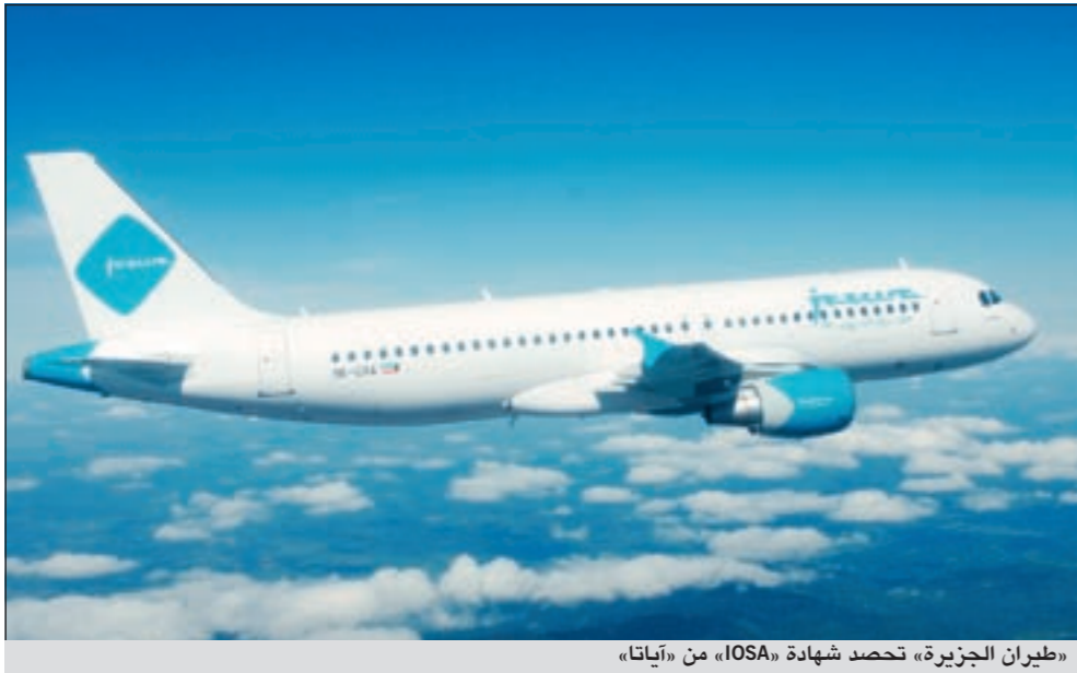
«طيران الجزيرة» تحصد شهادة «IOSA» من «آياتا»

أعلنت شركة طيران الجزيرة أنها حصلت على شهادة الـ «IOSA» التي يمنحها الاتحاد الدولي للنقل الجوي (آياتا)، لتقيدها وتميزها بالمعايير التي يشترطها الاتحاد على مراقبة السلامة التشغيلية وهي مقياس معترف به دولياً بين ناقلات العالم التي تتبع الاتحاد. وتضع هذه الشهادة طيران الجزيرة على قدم المساواة مع أفضل الناقلات العالمية المتحققة بالاتحاد الدولي للنقل الجوي.