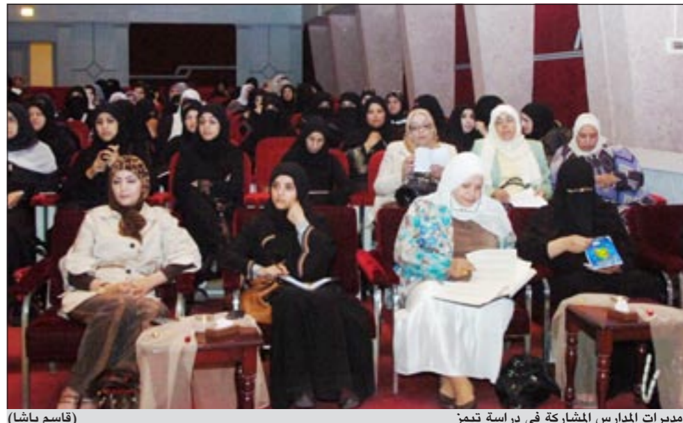
مديرات المدارس المشاركة في دراسة تيمز (قاسم باشا)

بعض المدارس للمشاركة من الكويت بالإضافة الى 59 دولة اخرى، مشيراً الى ان وزارة التربية قامت بدراسة عام 2007 على اختيار اي سؤال للطلبة ووجوده للأمتحنان على ان العمل يسير وفق الضوابط التي حددت من المنظم، موضحاً ان فترة الاختبار تستمر لمدة 36 دقيقة ثم تطوى الاوراق وتوزع استجابات على مدير المدرسة لمعرفة معلومات وصيغة عن المدرسة وممارسات التدريب ومؤهلات المعلمين وموارد المدرسة وسياساتها في تقييم الطلبة.