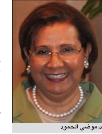
د. موزي الحمود

أصدرت وزيرة التربية ووزيرة التعليم العالي د. موزي الحمود قراراً بشأن نظام الغياب في المرحلة الابتدائية لتلاميذ الصف (الأول/ الثاني/ الثالث): ● بعد الاطلاع على قانون ونظام الخدمة المدنية لسنة 1979 وتعديلاتها. ● بالإشارة إلى القرار الوزاري رقم (2008/357) الصادر بتاريخ 2008/8/25 بشأن إقرار العمل بالوثيقة الجديدة لجمع صفوف المرحلة الابتدائية في الكويت اعتباراً من بداية العام الدراسي