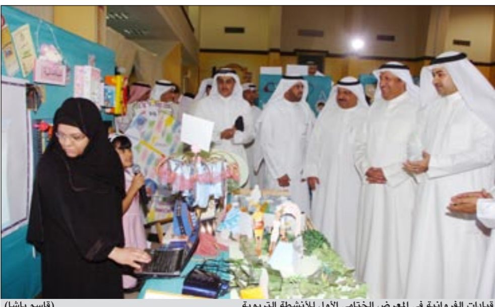
قيادات الفروانية في المعرض الختامي الأول للأنشطة التربوية

ان المعرض جمع بين المنتوجات الفنية البدوية المدة من قبل الطلبة والتي كانت حصيلية لجهود تربوية بإشراف معلومات المواد المختصة مما يؤكد على الوصول لهدف استثمار الطاقات الكامنة وتعزيزها نحو جهد تربوي خالص يعود بتنمية و قال مراقب إدارة الأنشطة المدرسية في المنطقة د. ماجد العلي ان المعرض جاء ايمانا بأهمية الدور الكبير لإدارة المنطقة نحو تشجيع ودعم المواهب الإبداعية الطلابية.