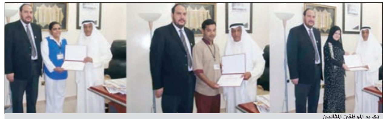
تكريم الموظفين المثاليين