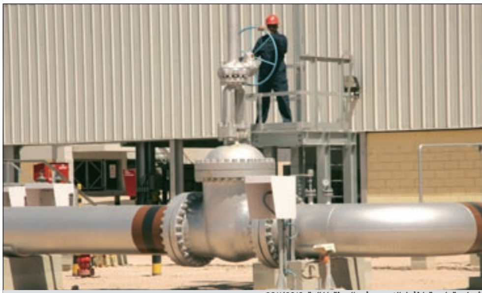
أرباح قياسية لنفط الكويت في السنة المالية 2010/2011

تقريباً. وأشار إلى أن الشركة نجحت في اكتمال المرحلة الثانية من برنامج تحسين استخلاص النفط، والانتهاء من دراسة فعالية حقن ثاني أكسيد الكربون كتقنية لتحسين طرق استخلاص النفط في الأماكن المختارة في حقول الروضتين والصابرية في شمال الكويت، كما تم إعداد تفاصيل تصميم المنشأة المتجربة.