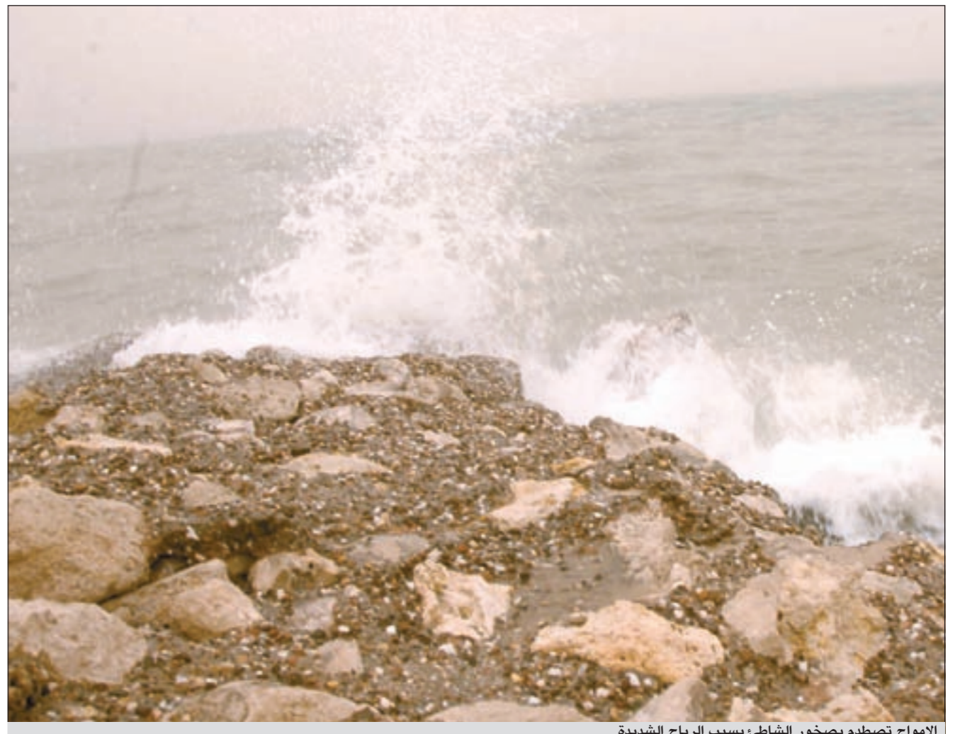
الامواج تصطدم بصخور الشاطئ بسبب الرياح الشديدة