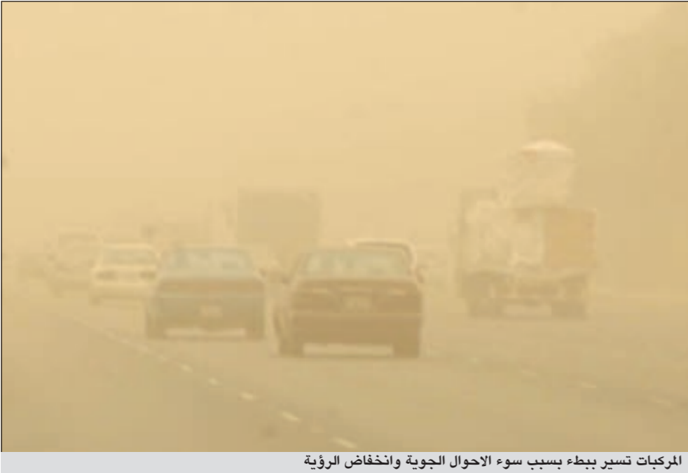
المركبات تسير ببطء بسبب سوء الاحوال الجوية وانخفاض الرؤية

إلى 40 كم/ساعة مثيرة للغبار مع فرصة لامطار متفرقة كانت رعدية أحيانا اما ليلاً فقد شهدت رياحا جنوبية شرقية تحولت الى شمالية شرقية معتدلة الى نشطة السرعة من 20 إلى 45 كم/ساعة مثيرة للغبار مع فرصة لامطار متفرقة تكون رعدية. وقد توقعت الارصاد ان يشهد طقس اليوم (الأحد) بالنيها طقسا غير مستقر والرياح شمالية شرقية تتحول إلى شمالية غربية معتدلة السرعة تنشط أحيانا من 15 إلى 40 كم/ساعة مثيرة للغبار مع فرصة لامطار متفرقة تكون رعدية أحيانا أما ليلاً فقد تنخفض الرؤية الأفقية بسبب الغبار العالق والرياح شمالية غربية خفيفة الى معتدلة السرعة من 12 إلى 32 كم/ساعة.