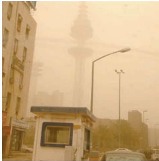
برج التحرير اختفى تقريبا وسط الغبار