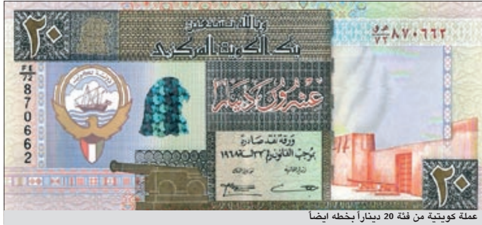
عملة كويتية من فئة 20 ديناراً بخطه أيضاً