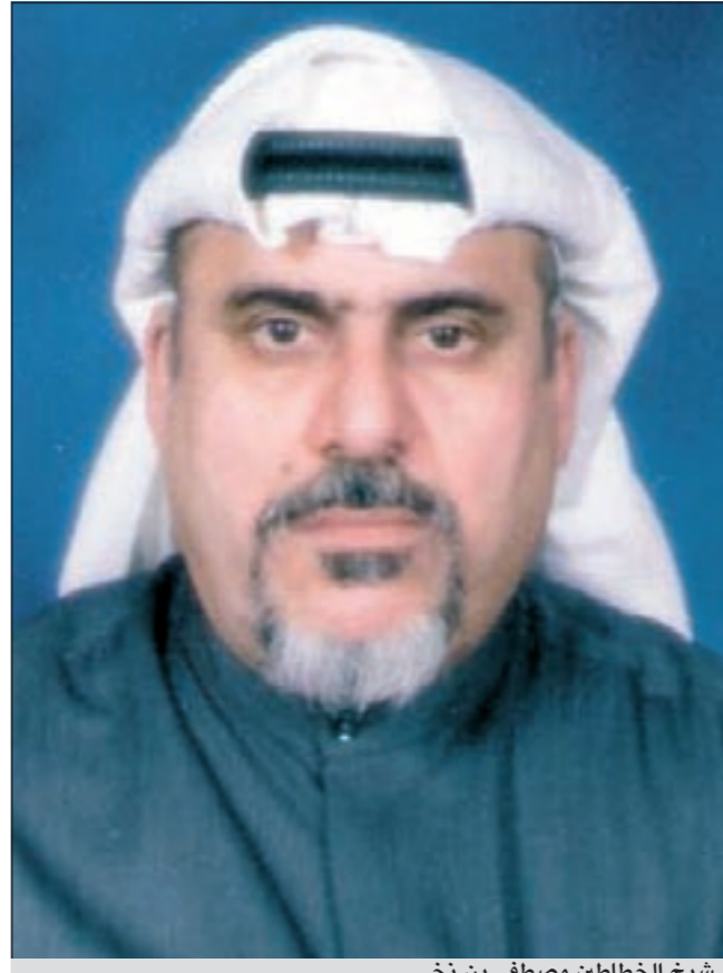
شيخ الخطاطين مصطفى بن نخي

قبل ثلاثة اعوام رحل عن عالمنا شيخ الخطاطين مصطفى بن نخي الذي توفي في السابع والعشرين من شهر ابريل عام 2008، وقد كانت له مكانة مرموقة في ميدان الخط العربي بأنواعه المختلفة، قام بخط الديناز الكويتي، والأوسمة الإميرية، اشتهر ببراعته الفائقة في تصميم الشعارات والأوسمة بمختلف اشكالها وانواعها.