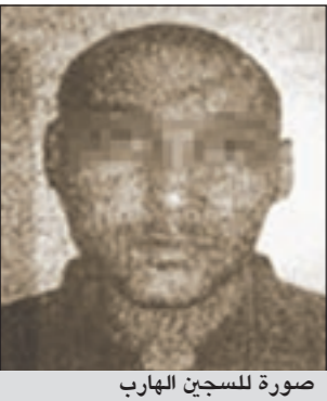
صورة للسجين الهارب

تحقيق موسع لكشف ملايسات هروب السجين الخليجي