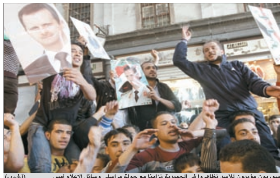
سوريون مؤيدون للاسد تظاهروا في الحميدية تزامناً مع جولة مراسلي وسائل الإعلام أمس (أ.ف.ب)

دمشق - وكالات: نقلت وكالة رويترز للأنباء عن سكان مدينة درعا السورية أن السلطات أدخلت مزيداً من الدبابات إلى المدينة أمس، وأن اطلاق نار كثيفاً سمع في المدينة، بينما نظمت وزارة الاعلام السورية جولة لمراسلي وكالات الأنباء ومحطات الإذاعة والتلفزة العربية والاجنبية المعتمدين في دمشق شملت عدداً من احياء وأسواق دمشق القديمة. وتقول المرسلون في اسواق الحميدية والبيزورية وساحة الجامع الأموي ومدحت باشا، حيث بدأ ان هذه الأماكن والمحال التجارية تشهد حركة طبيعية واعتيادية سواء من حيث حركة البيع او توافد المتسوقين من سوريين وعرب واجانب بحسب «كونا».