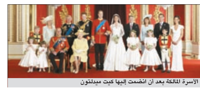
الأسرة المالكة بعد أن انضمت إليها كيت ميدلتون

مشاهدو زفاف القرن على الإنترنت أكثر من كأس العالم 59