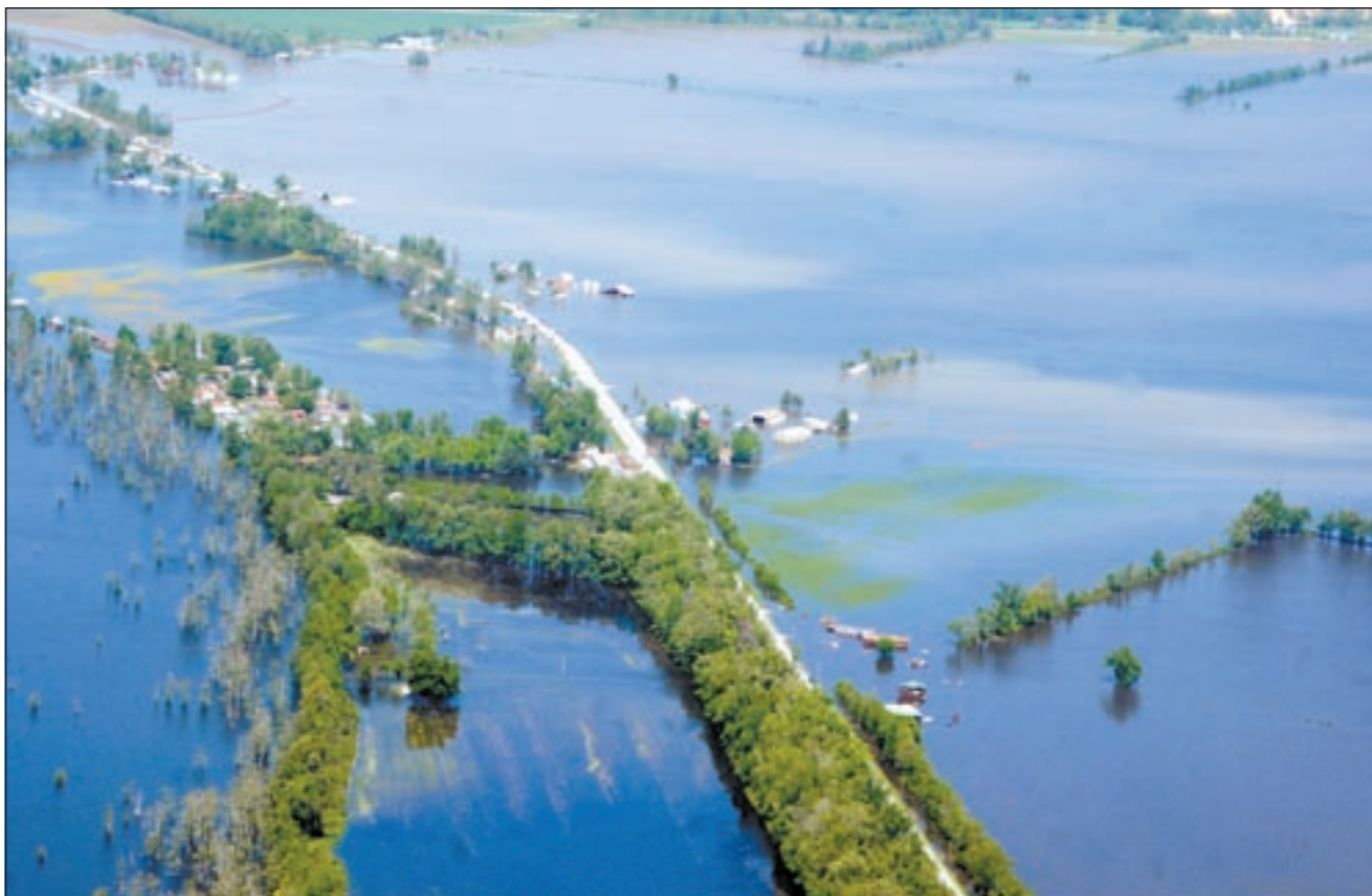
الفيضانات التي أعقبت الإعاصير أغرقت مدناً بأكملها

أخرى مساء الأربعاء وصباح الخميس إلى 294 قتيلًا حسبما ذكرت شبكة «سي.إن.إن» الإخبارية. وحذرت الملحقة السعودية والفضلية والسعودية في أميركا في تعميم عاجل أرسلته إلى الطلاب السعوديين والمتبعين الدارسين في ولايات تكساس، او كلاهما، أركنساس، لوزيانا، مسيسيبي، وميزوري، بتوخي الحذر واتباع تعليمات السلامة التي تصدر من سلطات المحلية في الولايات الجنوبية بعد الأعاصير القوية التي تضرب الجنوب الأميركي. وقد وجه الملحق الثقافي د.محمد العيسى الطلاب بالتواصل مع القنصلية العامة في هيوستن محذرا في الوقت نفسه من أعصار قد يضرب تلك الولايات.