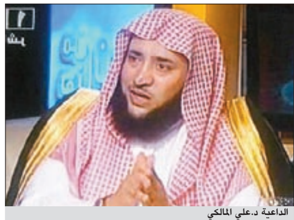
الداعية د.علي المالكي

عفا أحد المواطنين السعوديين عن «خادمة»، كانت قتلت والده قبل 4 سنوات، وحكم عليها بالقصاص، وذلك في اتصال بأحد البرامج المباشرة ظهر الخميس على القناة السعودية الأولى، إذ كان موضوع الحلقة «العفو.. أفضل من الحق». وبرنامج «من هنا نبدأ» الذي بدأ بثه عند الساعة الواحدة من ظهر امس الأول على القناة السعودية الأولى من تقديم د.عبدالمحسن البكر كان استضاف فضيلة الشيخ الداعية د.علي المالكي.