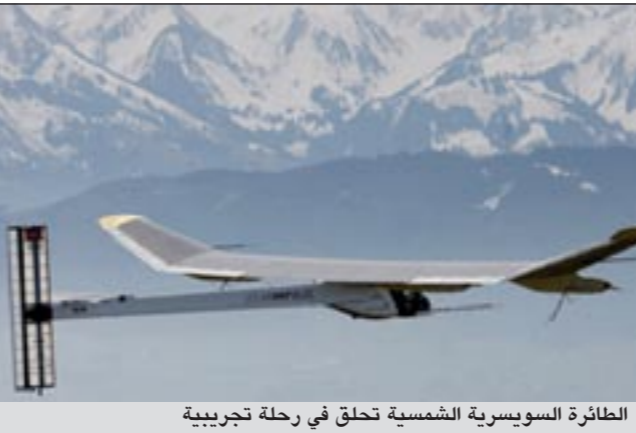
الطائرة السويسرية الشمسية تحلق في رحلة تجريبية