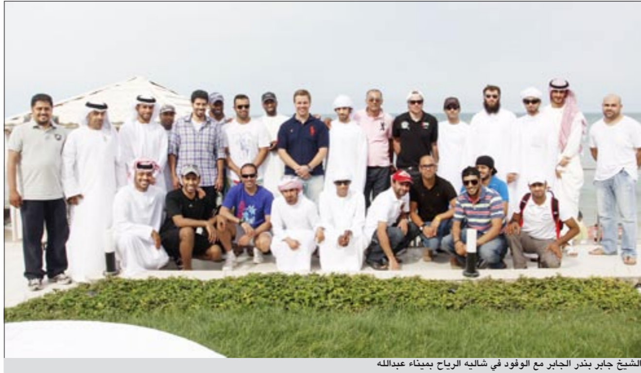
الشيخ جابر بندر الجابر مع الوفود في شاليه الرياح بميناء عبدالله