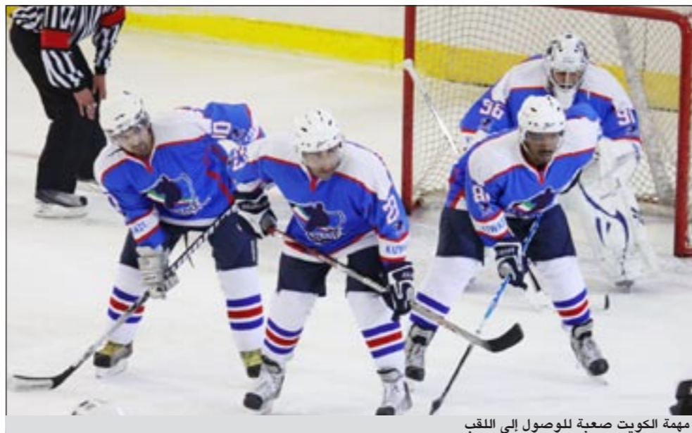
مهمة الكويت صعبة الوصول إلى اللقب

يخوض منتخبنا الوطني للهوكي الجليد مواجهة نارية في الساعة الـ 3:30 مساء اليوم أمام منتخب هونغ كونغ في اليوم الخامس من منافسات بطولة كأس آسيا للتحدي للرجال التي تستضيفها صالة التزلج من 25 الجاري حتى الاول من مايو المقبل تحت رعاية سمو رئيس الوزراء الشيخ ناصر المحمد وبإشراف الاتحاد الدولي للعبة.