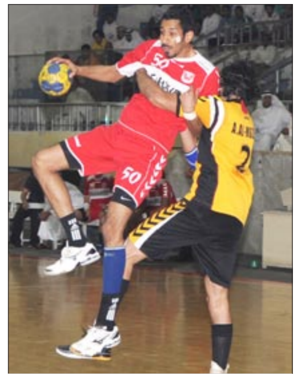
دفاع قدساوي وهجوم من الفحيحيل