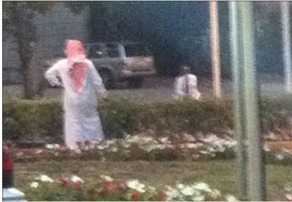
..ويجلس واضعاً سلاحه الرشاش اسفل ذقنه ويبدو اللواء ابراهيم الطراح محاولاً اقناعه بالعدول عن تنفيذ الانتحار

إذا كان هناك من يستحق الشكر فهم جميع رجال الأمن يتقدمهم اللواء ابراهيم الطراح الذي عرض حياته لمخاطر جمة وحرص أكثر من 15 مرة على ان يقترب من المواطن في محاولة كي يعدل عن الانتحار ورغم هذه المخاطر إلا ان اللواء الطراح جازف بحياته، ايضاً فقد حاول عدد من قيادات الأمن التقدم ومنهم اللواء طارق حمادة واللواء مصطفى الزعابي واللواء محمود الطباخ.