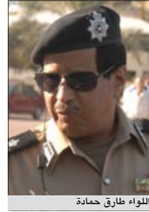
اللواء طارق حمادة