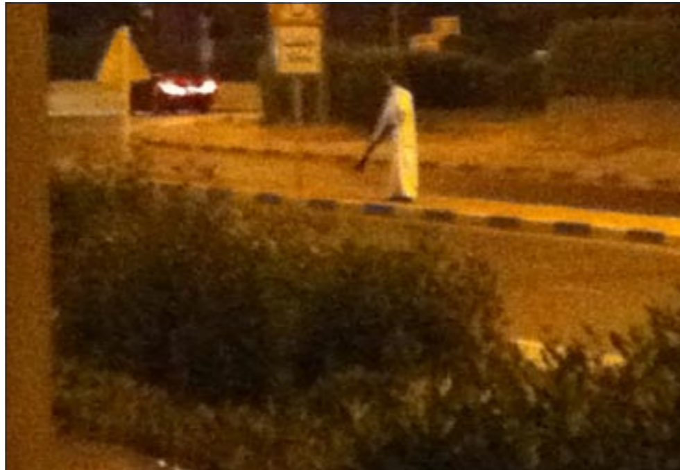
طلب زجاجة مياه ونفذ انتحاره مع شروق الشمس