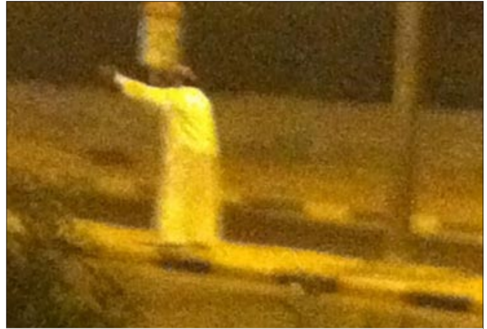
المواطن قبل انتحاره يطلب من رجال الأمن الابتعاد عنه