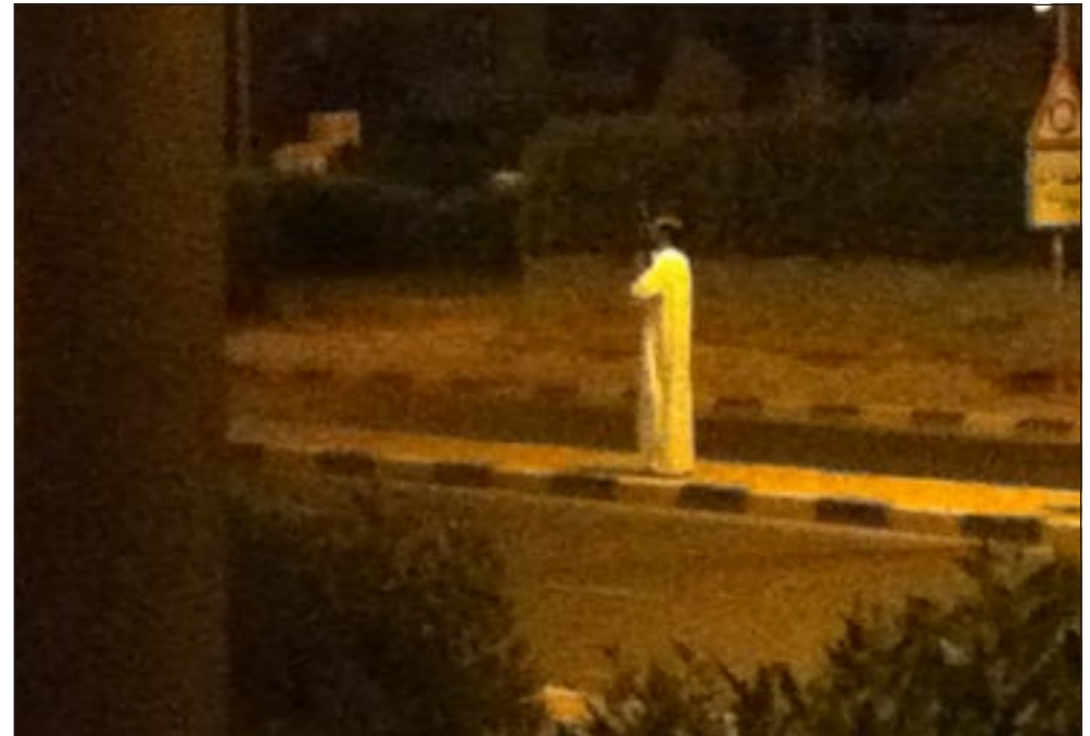
يتوسط الحارة الوسطى ورجال الأمن اغلقوا الطريق خشية على المارة