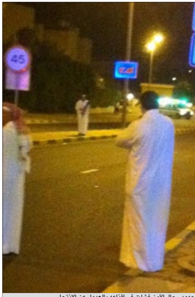
جهود رجال الأمن فشلت في اقناعه بالعدول عن الانتحار

تسمحون لها بالشكوى ضدي وأنا المهدي المنتظر؟»