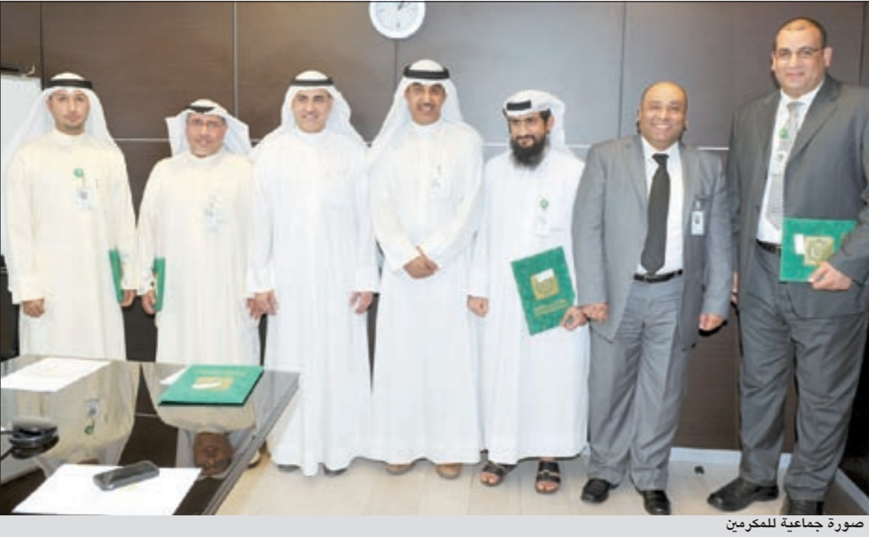
صورة جمعية للمكرمين