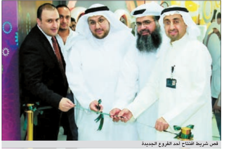
قص شريط افتتاح أحد الفروع الجديدة

وقال بنك الكويت المركزي في نشرته اليومية على موقعه الإلكتروني أن سعر صرف الدينار مقابل الجنيه الاسترليني ارتفع ليسجل 0,458 دينار في حين بقي سعر صرف الين الياباني دون تغيير عند سعر 0,003 دينار بينما ارتفع سعر الفرنك السويسري ليسجل 0,315 دينار.