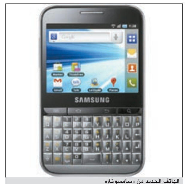
الهاتف الجديد من «سامسونغ»

أعلنت سامسونغ للإلكترونيات عن إطلاق هاتف «GALAXY Pro» الذكي، الذي يتميز بمركز التواصل الاجتماعي المتكامل Social Hub Premium وتكنولوجيا المسح المزدوج عبر الشاشة، ولوحة مفاتيح كاملة (QWERTY)، بالإضافة إلى أنه يوفر دعماً كاملاً للغة العربية، ويعتبر مرافق المثالي في حياتك العملية المعقدة بالتقنيات الذكية، وهو متوافر حالياً في جميع دول الخليج. ويملك مركز التواصل الاجتماعي المتكامل وصولاً بلمسة واحدة إلى كل من بريدك الإلكتروني، ورسائلك الفورية، وحساباتك على الشبكات الاجتماعية. ويقترن ذلك مع السرعة والتحكم المنفوق عبر واجهة «GALAXY Pro» ذات تقنية المسح المزدوج، مما يبيّن على تواصل مع حياتك العملية والاجتماعية.