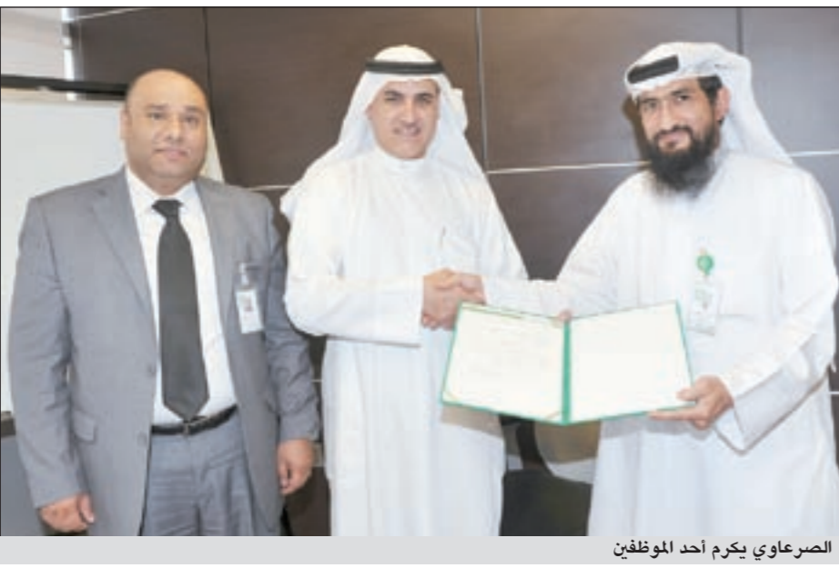
الصراعي يكرم أحد الموظفين

تشكيل لجنة متخصصة لدراسة وتقييم الاقتراحات التي تقدم من جميع الإدارات والقطاعات واعتمدت معايير مهنية دقيقة لهذه الاقتراحات أبرزها توافرها مع السياسة العامة للمؤسسة، وأن يأتي الاقتراح بفكرة أو منتج أو خدمة جديدة أو يساهم في تحسين مستوى الخدمة وتطويرها، إضافة إلى أهمية أن يكون الاقتراح قابلاً للتنفيذ ومتضمناً خطوات ومراحل التنفيذ، وأن يساهم بفاعلية في تخفيض المصروفات وزيادة الكفاءة الإدارية، وأشار الصراعي إلى أن اللجنة المعنية تستقبل دائماً اقتراحات بناءة من مختلف إدارات وقطاعات «بيتك»، كما تفصل غالبية الإدارات في مناسبات التكرم، الأمر الذي يعزز استمرارية طرح الخدمات والمنتجات الجديدة، ويعكس المكانة الريادية للمؤسسة، معرباً عن اعتزازه بان معظم المنتجات والخدمات التي طرحت وكان لـ «بيتك» السهم في تقديمها على مستوى السوق كانت من أفكار ومبادرات موظفيه