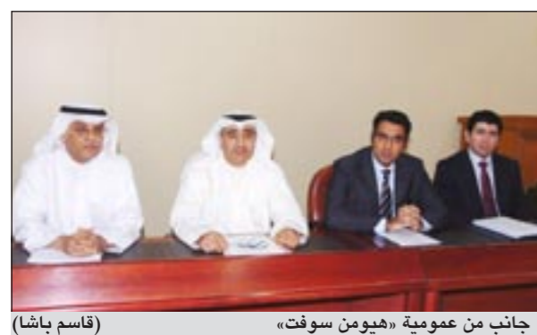
جانب من عمومية «هيومن سوفت»

وذكر أن كلا من الجامعة والكلية استثمرت علاقة التعاون الأكاديمي مع جامعة بورو الأميركية حيث تمكنت وفي وقت قصير من خلق طلب كبير، ومعدل عال في عدد الطلاب المسجلين لديها. ومازال العمل مستمرا على إكمال مراحل بناء الحرم الجامعي ليكون جاهزا لاستقطاب أفضل الطلبة في تخصصات إدارة الأعمال والهندسة المختلفة، كما تقوم كل من الجامعة والكلية باستمرار بطرح تخصصات جديدة لمواكبة تطورات سوق العمل والرغبات العلمية