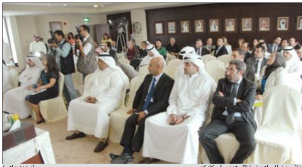
جانب من المساهمين خلال عمومية «كامكو»