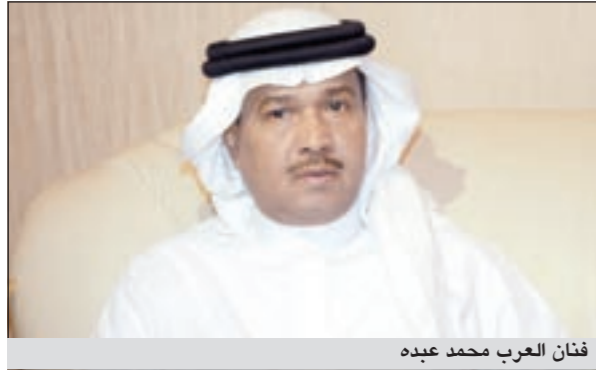
فنان العرب محمد عبده