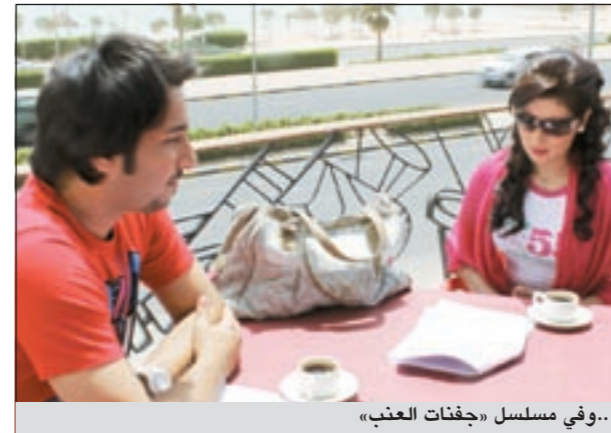
..وفي مسلسل «جفئات العنب»