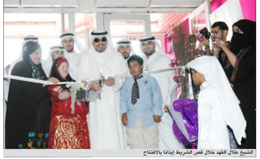
الشيخ طلال الفهد خلال قص الشريط إيدانا بالافتتاح