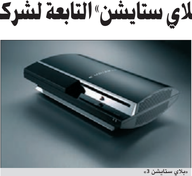
«بلاي ستايشن 3»