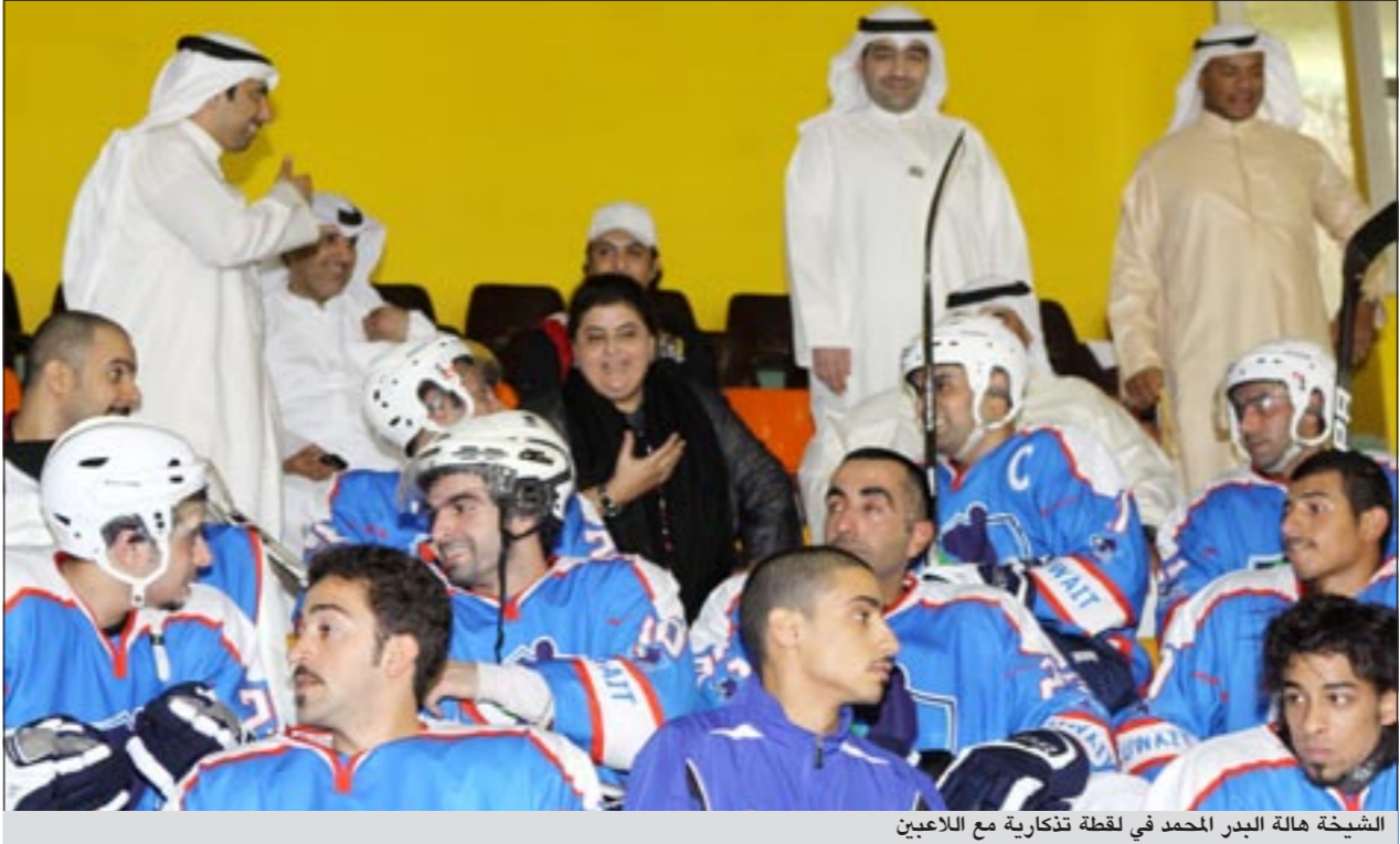
الشيخة هالة البدر المحمد في لحظة تذكارية مع اللاعبين