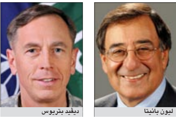
ليون بانيتا ديفيد بتريوس

واشنطن - رويترز - يو.بي.أي: قال مسؤولون أميركيون أمس إن الرئيس الأميركي باراك أوباما يعزّم ترشيح مدير وكالة المخابرات المركزية الأميركية ليون بانيتا لمنصب وزير الدفاع وسيجل محله الجنرال ديفيد بتريوس القائد الحالي للعمليات العسكرية في أفغانستان. ويعزّم أوباما أيضاً ترشيح الدبلوماسي المخضرم ريان كروكر كسفير مقبل للولايات المتحدة لدى أفغانستان.