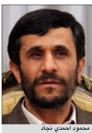
محمود احمدي نجاد

وقد تواري الرئيس الإيراني عن المسرح السياسي بعيد محاولته الفاشلة الأسبوع الماضي إقالة وزير الاستخبارات حيدر مصليحي، التي