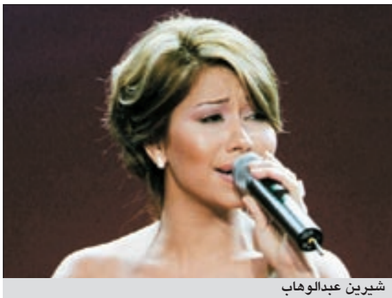
شيرين عبد الوهاب

أرجعت المطربة شيرين عبد الوهاب سبب تأخرها في أداء أغنية مغربية إلى عجزها عن إتقان اللهجة المغربية وصعوبة فهمها، رغم عشقها لهذا البلد، وقالت شيرين إنها تهتم بلقاة الشعب المغربي الذواق للفن، وتحرص على تقديم الأفضل له سواء في الغناء أو السينما.