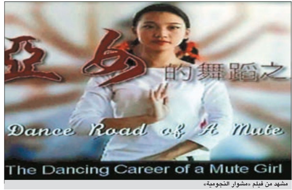
مشهد من فيلم «مشوار النجومية»

الفني والثقافي لهذا البلد حيث تابعوا الفيلم الصيني «العادات والتقاليد في المراعي» الذي يسلط الضوء على اهم العادات والتقاليد التي تمارس في الرعي هناك، كما