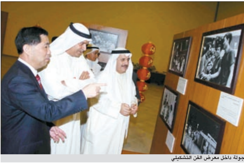
جولة داخل معرض الفن التشكيلي