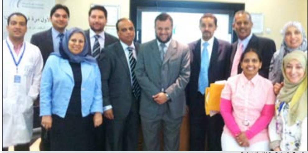
فريق الكلية خلال الزيارة

الرئيسي للاستشارات والفحوصات المخبرية في الكويت ومنطقة الخليج، مشيرا الى ان برنامج الاعتراف بنظام متكامل للجودة والنوعية ويشمل جميع الجوانب الفنية والإدارية والموارد البشرية العاملة والسلامة في المختبرات. وأوضح ان (CAP) هي أكبر مؤسسة عالمية في هذا المجال وتخدم أكثر من 16 ألف مختبر في مختلف أنحاء العالم وهي الرائدة في برامج ضبط الجودة. وأخيرا، يكون مختبر المتحدة المركزي للتحاليل الطبية أول مختبر في الكويت يحصل على الاعتراف الدولي (CAP) و ISO:2007:18159 في مجال المختبرات.