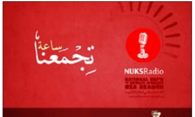
شعار «ساعة تجمعنا»