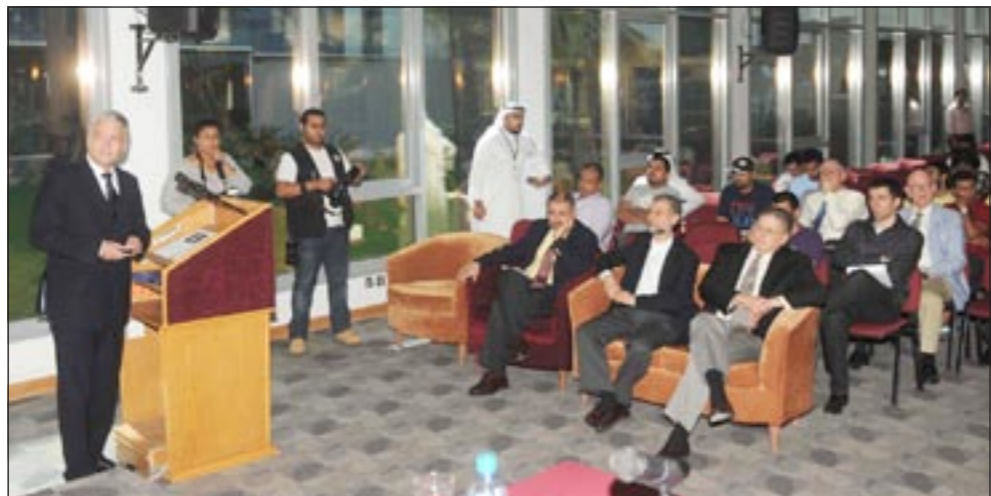
السفير الهولندي خلال محاضرته في الجامعة الأميركية (متين غوزال)

اوخسبه عن الحلول، مشيرا الى انها تكمن في الاجراءات التي تتبعها الحكومات عن طريق دراسة المشاريع مثلا، مشددا: على الشركات ان تلتزم بالمقاييس التي تحترم البيئة. ودعا الحكومة في الكويت الى أن تعمل وفق نظام معين في هذا الامر كان تقوم قبل تنفيذ المشروع مثلا بتشكيل لجنة تدرس المشروع وترى مدى فوائده وأضراره على البيئة. كما دعا الكويت الى التفكير في استخدام السيارات الخضراء صديقة البيئة وذلك لتخفيف من التلوث البيئي الذي تسبب في ارتفاع درجات حرارة الأرض، مما يؤدي الى التغيير المناخي. وكذلك تولي أهمية قصوى لإدارة النفايات، والمحافظة على المياه، وحفظ الطاقة، وأيضا التغيير في نمط الحياة.