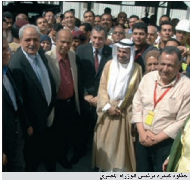
حفاوة كبيرة برئيس الوزراء المصري