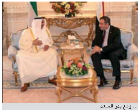
.. ومع بدر السعد