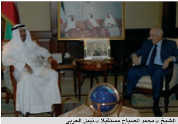
الشيخ د.محمد الصباح مستقبلاً د.فاضل صفر

استقبل نائب رئيس مجلس الوزراء وزير الخارجية الشيخ د.محمد الصباح وزير الخارجية المصري نبيل العربي والوفد المرافق له وذلك بمناسبة زيارته للبلاد.