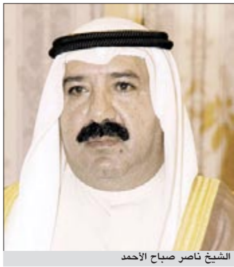
الشيخ ناصر صباح الأحمد

مصدر مقرب من الشيخ ناصر صباح الأحمد ينفى عرض منصب نائب رئيس مجلس الوزراء ووزير الدفاع عليه