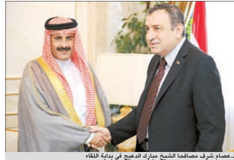
د.عصام شرف مصافحاً الشيخ مبارك العديج في بداية اللقاء

شرف: دول «التعاون» عمق إستراتيجي للغرب ومصر.. وأمنها خط أحمر