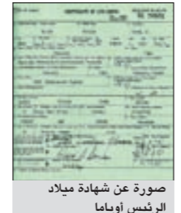
صورة عن شهادة ميلاد الرئيس أوباما