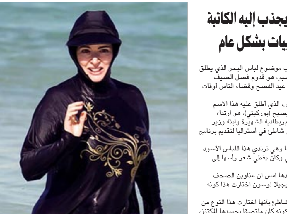
نايجيلا لوسون ب «البوركيني الشرعي»

تحت عنوان «أنا فخور بأن أكون خاتنا لاميركا»، وفي مجلة «الشامخة» النسوية تختلط نصائح «العناية بالبشرة»، بلون الدم وحض الأزواج على القتال والعنف. وتخلط المجلة في أبوابها بين الجمال والموضة، وتقدم نصائح تشجع النساء على دفع أزواجهن على درب الشهادة. والعدد الأول من «الشامخة»، يصدر عن مركز «الفخر» للإعلام، أحد أكبر المؤسسات الإعلامية التابعة لتنظيم القاعدة. وتحمل الأجلة الجديدة في أسلوب «استهداف ووسائله رغم أنها ليست المرة الأولى التي توجه «القاعدة» خطابه للنساء بشكل خاص، فقلما يخلو عدد من المجلات التي أصدرها التنظيم طوال السنوات الماضية من مواضيع