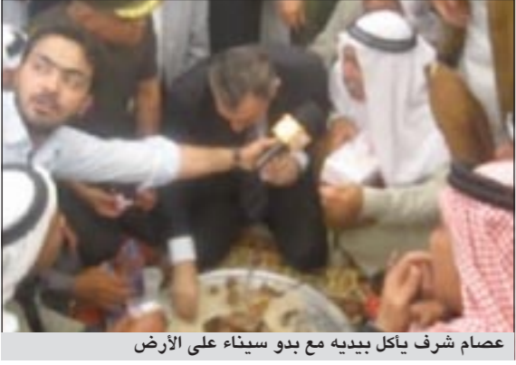
عصام شرف يأكل بيديه مع بدو سينا على الأرض

جالسا على الأرض، يأكل بيديه، ويحتسي مع بدو سينا الشاي بعد أن أكل كبسة سيناوي، هذا هو حال عصام شرف، أول رئيس وزراء يزور شيوخ وقبائل شمال وجنوب سيناء منذ عهد الرئيس الراحل أنور السادات.