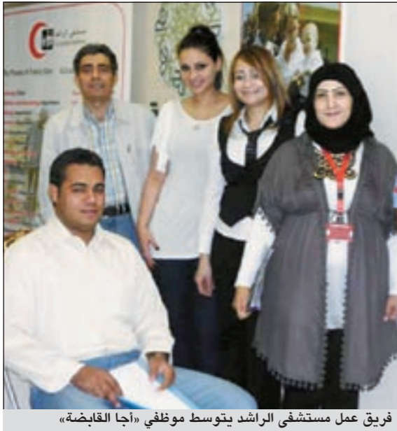
فريق عمل مستشفى الراشد يتوسط موظفي «أجا القابضة»

نظم مستشفى «الراشد» الرائد الأول لرعاية العائلة برنامجا خاصا للقيام بعدة زيارات لمقر الشركات الكبرى من خلال تنظيم يوم توعوي مفتوح، حيث قصد «الراشد» هذه المرة مقر شركة «أجا القابضة» قبل أيام. ووفقا للبرنامج المعد مسبقا تم تخصيص جناح خاص للمستشفى وعرض خدماته الطبية والصحية، إذ لاقي الأمر استحسان جميع العاملين بالشركة حيث قاموا بعمل فحوصات طبية وأخذ معلومات صحية وتقديم كل ما هو جديد في عالم الصحة.